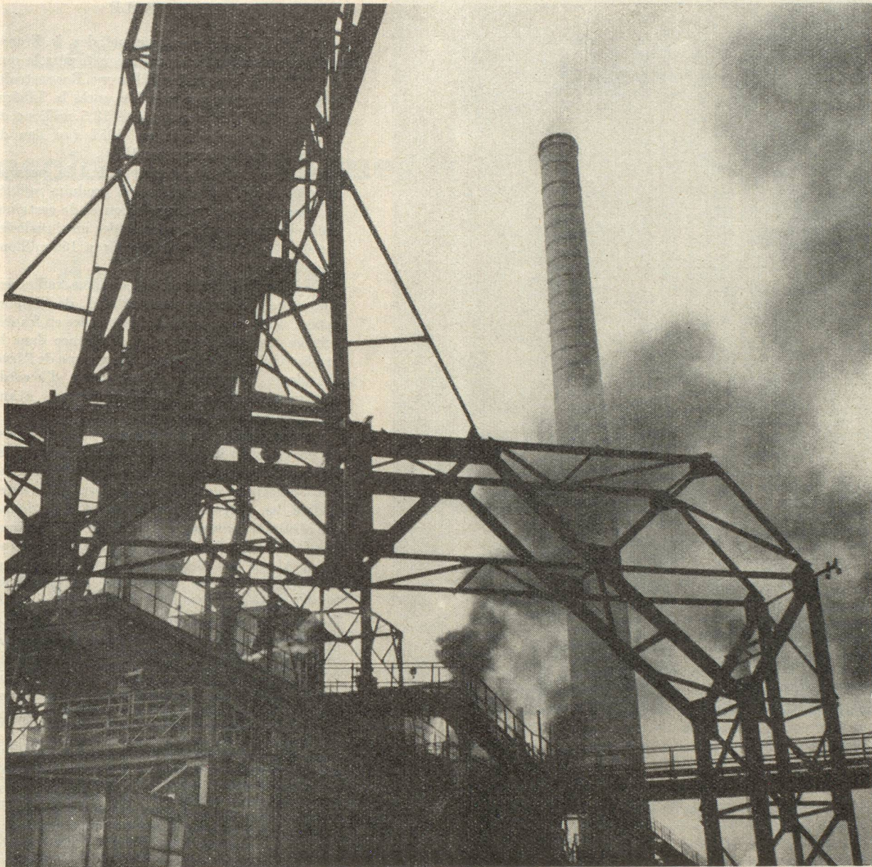
« L'œuvre de modernisation a porté sur la réalisation de grands ensembles... » Cokerie de Carling

avec un effectif « fond » nettement inférieur à celui de 1929 (169.000 mineurs au lieu de 209.000).