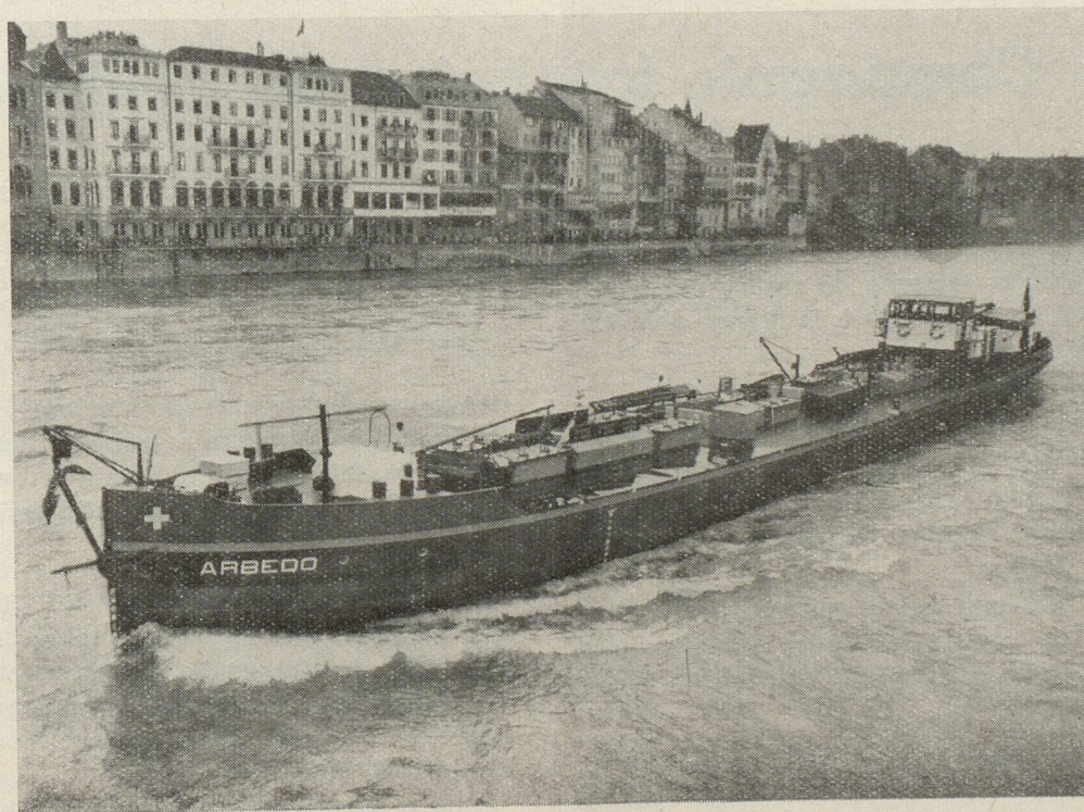
Pétrolier battant pavillon suisse sur le Rhin.