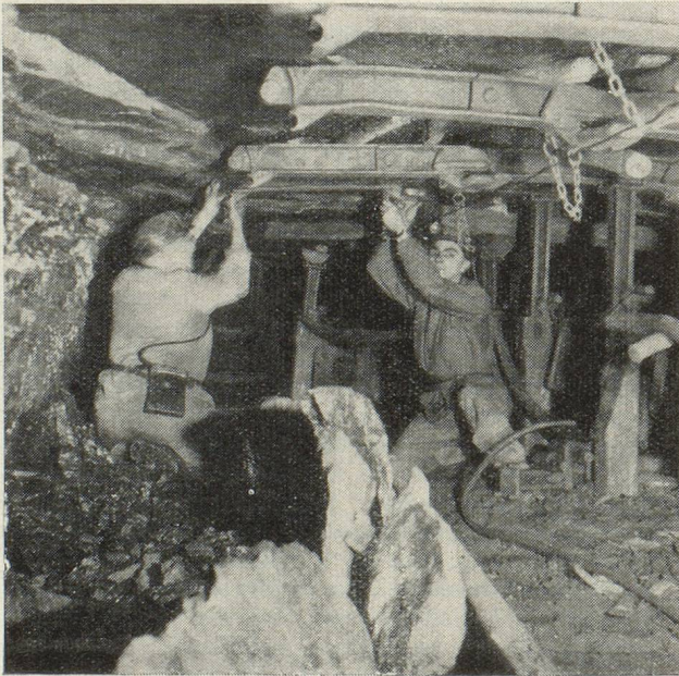
Posé de soutènements métalliques

d'autrefois. Aussi, bien que l'indice d'activité économique français ait depuis 1949 retrouvé à peu près les niveaux atteints en 1929, les importations de charbon sont, elles, demeurées, expéditions sarroises comprises, à un niveau beaucoup plus modeste. D'autre part, un fournisseur nouveau est apparu sur le marché français : les États-Unis d'Amérique, qui deviennent, à partir de 1946, le plus gros fournisseur. Cet appoint a été essentiel et, du reste, très variable selon les années : de 5 millions de tonnes en 1946, il passe à 12 environ en 1947, retombe à 9 en 48, à 4 en 49, à presque rien en 1950 pour remonter en 1951 à un peu moins de 5 millions de tonnes. C'est en effet grâce à lui qu'ont été comblés les déficits qualitatifs en charbons à coke et anthracites dus à l'éclipse de la Grande-Bretagne et de l'Allemagne. En outre, seules les fournitures américaines étaient en mesure de combler le lourd déficit de l'extraction française causé par les grandes grèves de 1947 et 1948 ; le recours au charbon américain trouvait du reste ses limites à la fois dans la pénurie de dollars et dans l'impossibilité de trouver indéfiniment du frêt.