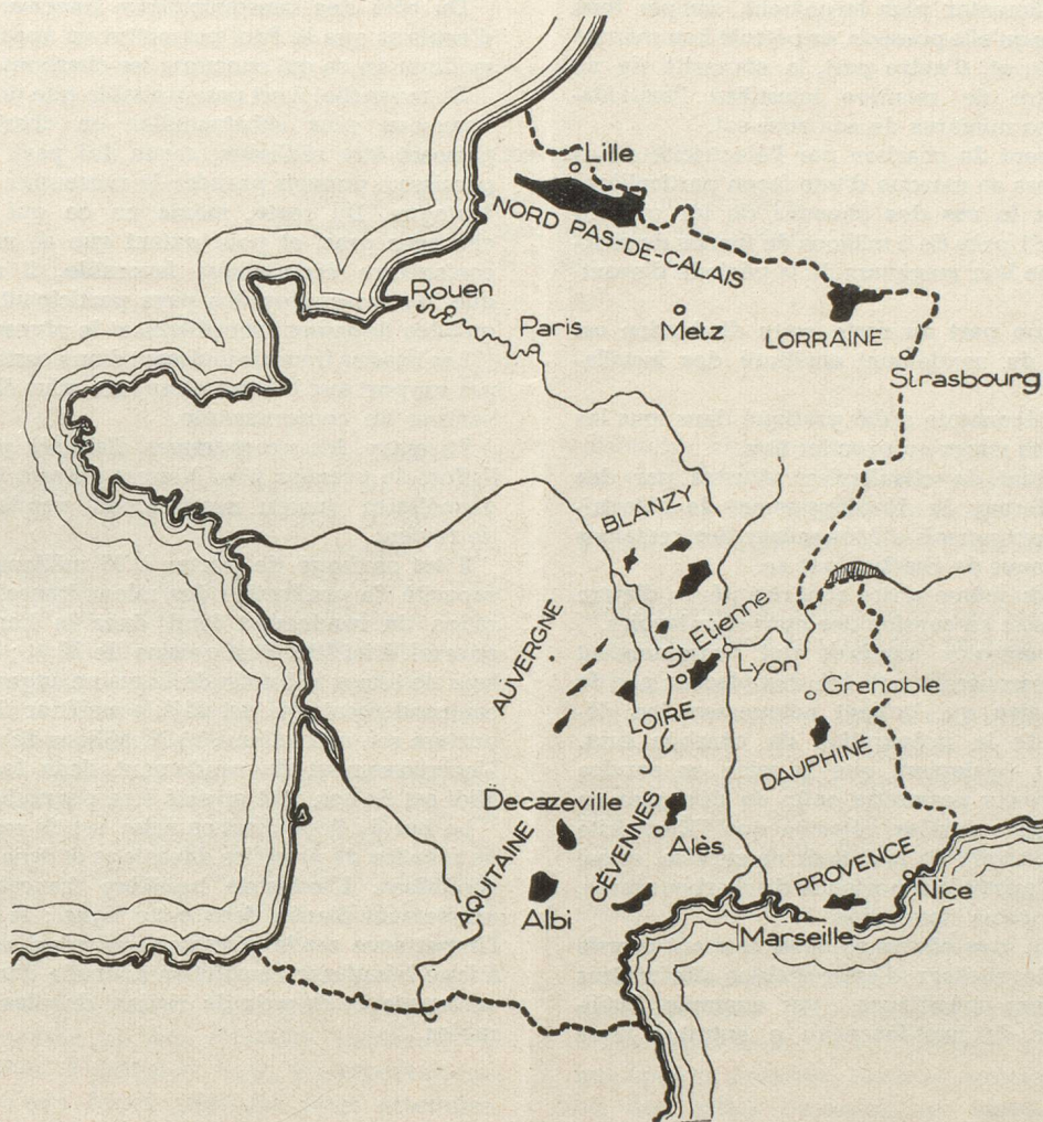
Carte des gisements charbonniers français

Si les tendances ainsi enregistrées s'accroissent encore dans les années à venir, l'industrie française de la construction électrique devra s'adapter aux besoins nouveaux et, sans doute, il devrait être fait appel encore à l'industrie suisse dont la contribution aux installations déjà réalisées, ou en cours de montage, en Normandie, dans la région parisienne et en Lorraine est déjà importante.