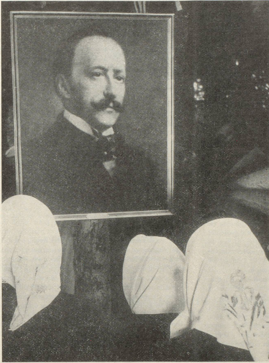
Trois jeunes filles de la vallée de Conches en contemplation devant le portrait de César Ritz.