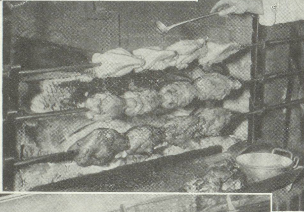
Volailles de Bresse à la broche