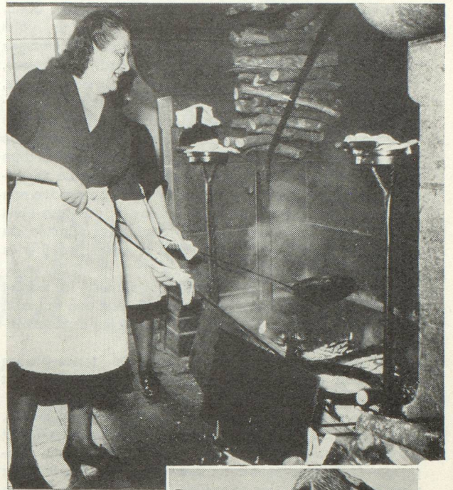
Les omelettes de la mère Poulard au Mont Saint-Michel