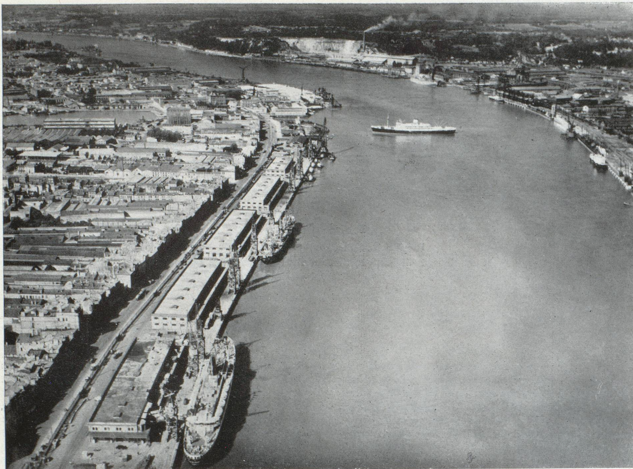
Port de Bordeaux, vue vers l'aval ; un navire est en cours d'évitage

Ces mesures ne doivent avoir, à notre avis, qu'un caractère temporaire, car l'ensemble de ces territoires constitue un tout économique viable et riche d'immenses possibilités.