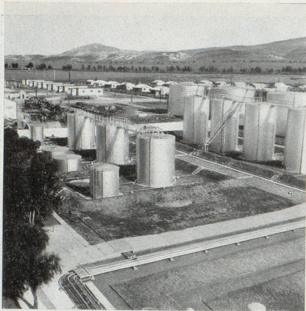
Raffinerie de pétrole de Petiyeen

tation ou d'une concession portant sur ce terrain. Dans l'ordre logique des choses, le premier droit qui puisse être attribué est un permis de recherche, les autres titres découlant de celui-ci sous certaines conditions. Le Maroc a choisi pour l'attribution du permis de recherche une règle très simple, celle de l'attribution au premier demandeur, règle qui n'admet que quelques rares exceptions prévues par la loi minière elle-même. Le demandeur n'a pas à rechercher l'accord du propriétaire du sol, il n'a pas non plus à faire preuve de ses capacités techniques et financières; l'État lui fait confiance a priori , mais le jugera ultérieurement sur l'activité déployée sur les permis attribués. Il n'y a donc pas d'« autorisation personnelle » comme dans plusieurs autres pays d'Afrique qui ont adopté par ailleurs le principe de l'attribution à la priorité de la demande. La seule limitation existant en ce domaine réside dans le nombre de permis que peut détenir une même personne ou société. Ce nombre ne peut dépasser 15, sauf dérogation accordée par le gouvernement. Cette limitation est faite pour éviter l'accaparement.