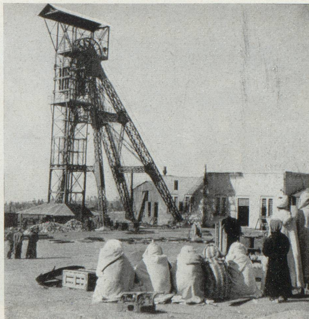
Mine de charbon

minéraux. Enfin le Centre des études hydrogéologiques, qui débordé le cadre minier proprement dit, est le conseiller technique indispensable de tous les organismes publics ou entreprises privées s'occupant de recherches d'eaux souterraines.