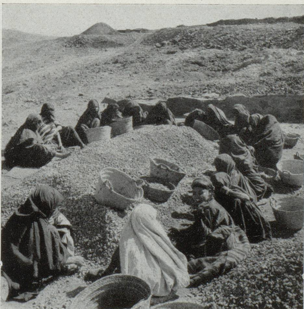
Mines de plomb de M'Fis : les femmes et les enfants des mineurs trient les parcelles de plomb après le lavage

Le développement minier du pays est largement favorisé par les travaux du Service géologique dont les différentes sections contribuent à la connaissance plus précise du sous-sol. La Section de la carte est à la base de l'édifice en dressant les cartes géologiques à différentes échelles qui permettent d'orienter les grandes recherches et les études particulières des gisements pour lesquelles d'excellents résultats ont été obtenus par la Section d'étude des gîtes