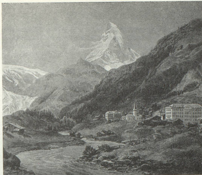
Zermatt et le Cervin

Conseiller d'État du canton de Vaud Vice-président de l'Office central suisse du tourisme