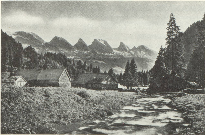
Les alpes du Toggenbourg