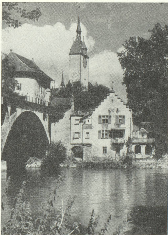
La jolie petite cité de Bremgarten

Une vie active anime cependant la grande cité bâloise de part et d'autre du Rhin, ainsi que nombre de petites villes et bourgades amènes dans leur physionomie comme dans leurs coutumes : Aarau, Baden, Bremgarten, Brougg, Laufon, Laufenbourg, Lenzbourg,