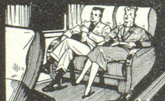
★ dans les fauteuils inclinables Air France.