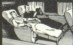
★ dans d'excellents fauteuils-couchettes.