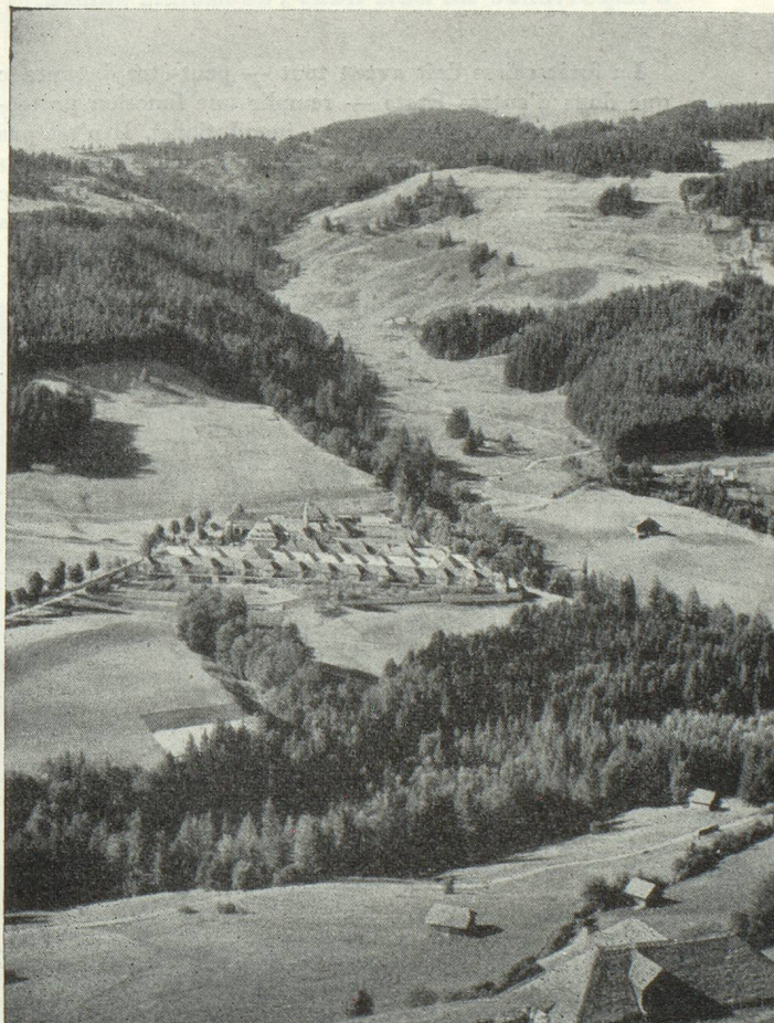
Forêt des Préalpes : La Valsainte (Fribourg)

C'est l'Inspection fédérale des forêts qui est chargée de remplir les tâches confiées à la Confédération en vertu de la loi forestière fédérale. A la tête de chaque canton se trouve un inspecteur cantonal des forêts qui, dans 4 petits cantons, est en même temps gérant. Les autres cantons sont subdivisés en arrondissements forestiers dont la gestion et l'administration sont confiées à un inspecteur forestier. L'étendue des arrondissements varie d'un canton à l'autre; elle est en général de 4 à 7.000 hectares, rarement supérieure à 10.000 hectares. Outre les arrondissements forestiers, il existe encore environ 60 administrations forestières