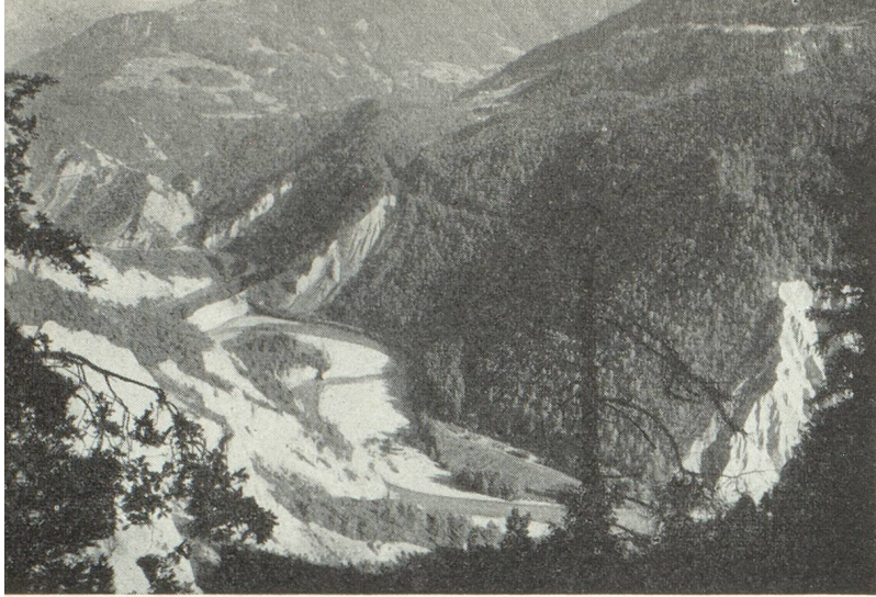
Forêt de montagne (Grisons)