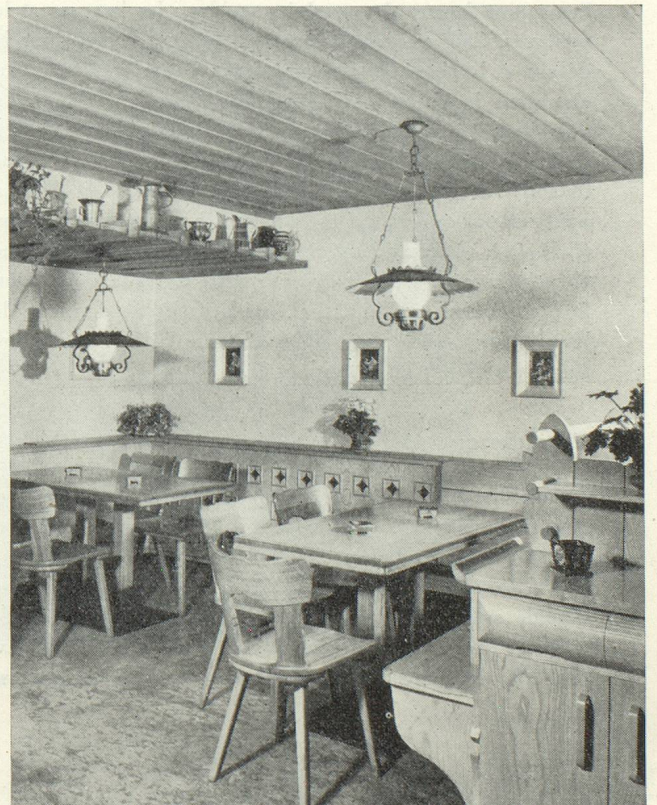
Aménagement d'un « Carnotzet »