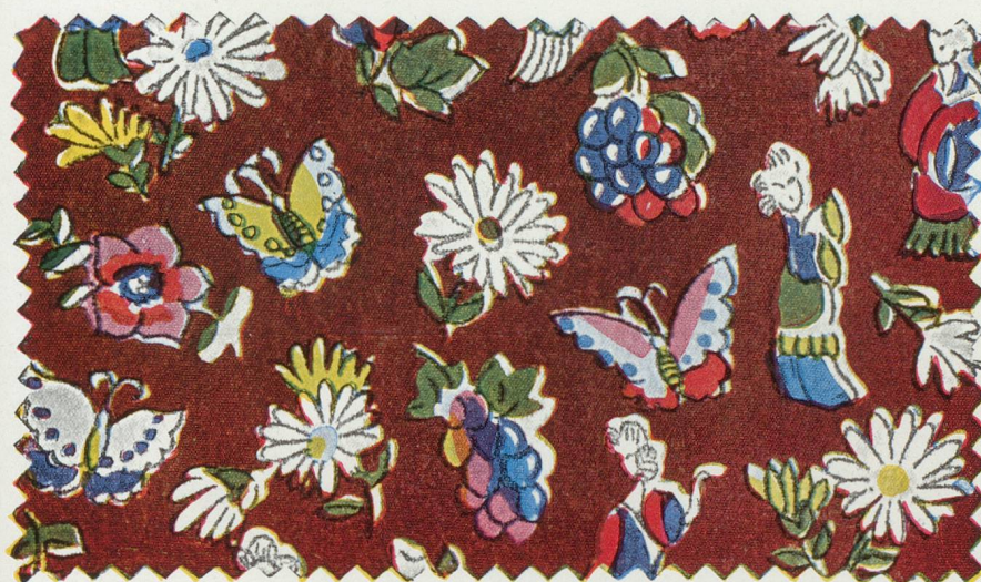
Impression directe sur rayonne soumise à une épreuve de lavage : en haut : impression non traitée, en bas : traitée avec un fixateur.