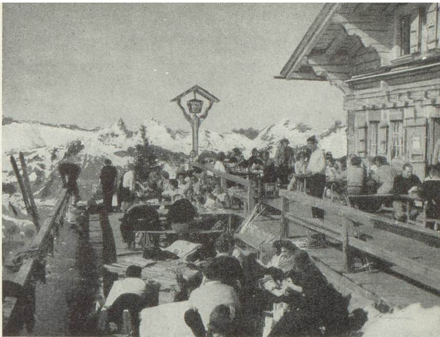
Une terrasse au Wasserngrat, au-dessus de Gstaad

de « mauvaise ». Grisaille et margouillis; brume glacée et oppressante; neige d'une couleur et d'une consistance innommables. Pieds mouillés; mains gourdes; goutte au nez; corps transi. Torpeur de l'esprit aussi; surtout quand, fatalement, le rhume vient encore en paralyser le mécanisme jusqu'à l'âme elle-même qui se sent triste dans son engourdissement.