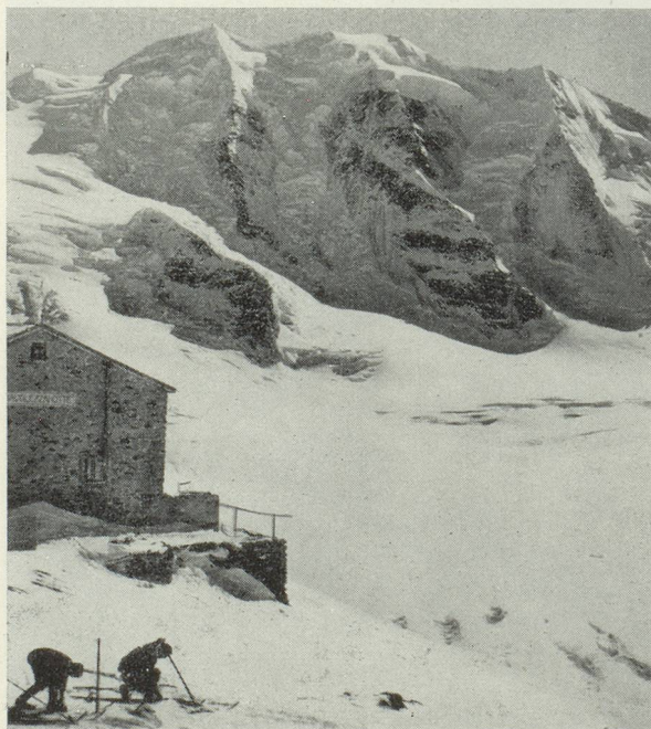
Cabane de la Diavolezza au-dessus de Pontresina

Et puis, la journée est loin d'être achevée. C'est l'avantage d'être soudain matinal! De retour au village, le contact humain reprend toute sa saveur après la relative solitude de l'exercice. Et l'on se sent d'humeur communicative, encouragé en cela par l'agréable habitude qu'ont les montagnards de fraterniser, sans excès de phrases, mais d'un mot cordial. Dans le hall de l'hôtel ou à la table d'hôte, vous vous surprendrez à engager le plus simplement du monde la conversation avec des inconnus que vous auriez obstinément ignorés ailleurs. Il y a une large place pour la camaraderie, une fois dépassée l'altitude de mille mètres. Les soirées sont longues? Vous n'aimez pas danser, vous ne croyez pas aux divertissements de la station? préjugés que vous n'attendez — avouez-le — qu'un signe du hasard pour balayer avec ravissement.