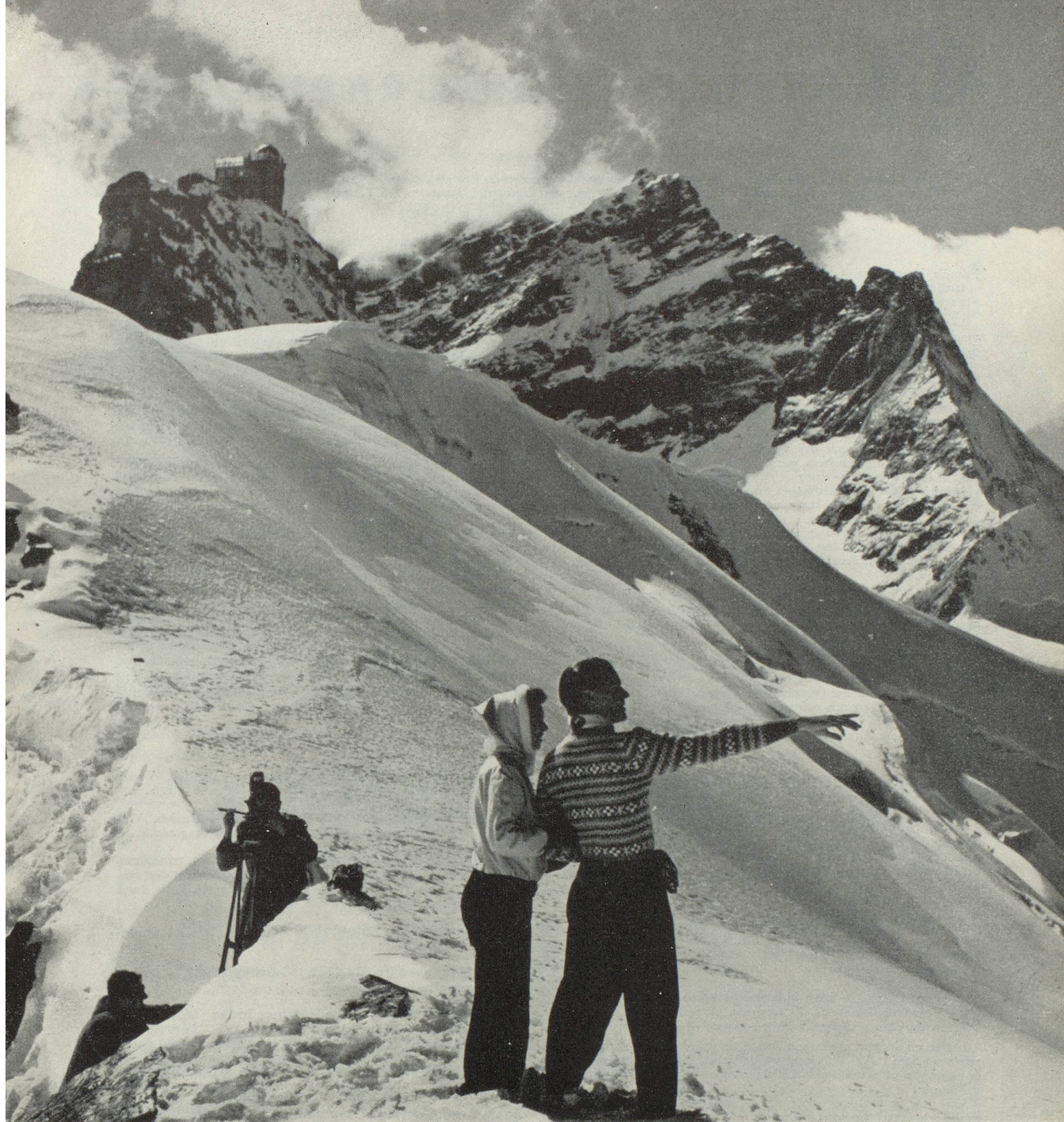
Ski de printemps au Jungfrauojoch

Et admettez encore cette vérité : depuis que vous êtes là, vous n'avez presque pas pensé à ceux que vous avez laissés, il y a si longtemps, vous semble-t-il, dans la grisaille et le margouillis. Et la carte postale que vous allez maintenant, en hâte, leur adresser comme une espèce de fiche de