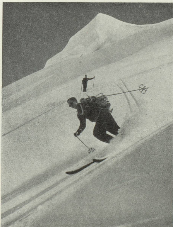
La descente de l'Eismeer (massif de la Jungfrau)

Pour prétendre en toute sincérité qu'on y trouve du charme, il faut rien tant aimer que se cloîtrer. Et avoir le loisir de le faire. Si ce n'est pas votre cas, nous nous mettrons aisément d'accord sur la définition d'une saison que l'homme de la rue n'a pas sans justes motifs qualifiée