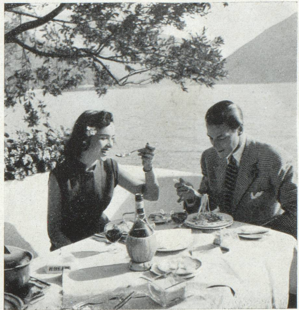
Au bord d'un lac tessinois

Je ne sais quel humoriste a prétendu un jour que le cochon nous fournit la plupart de nos spécialités.