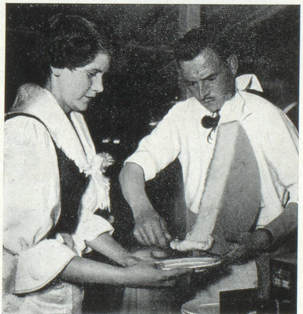
La raclette valaisanne

Les restaurateurs helvétiques savent aussi bien manier l'humour que la louche ; preuve en est la