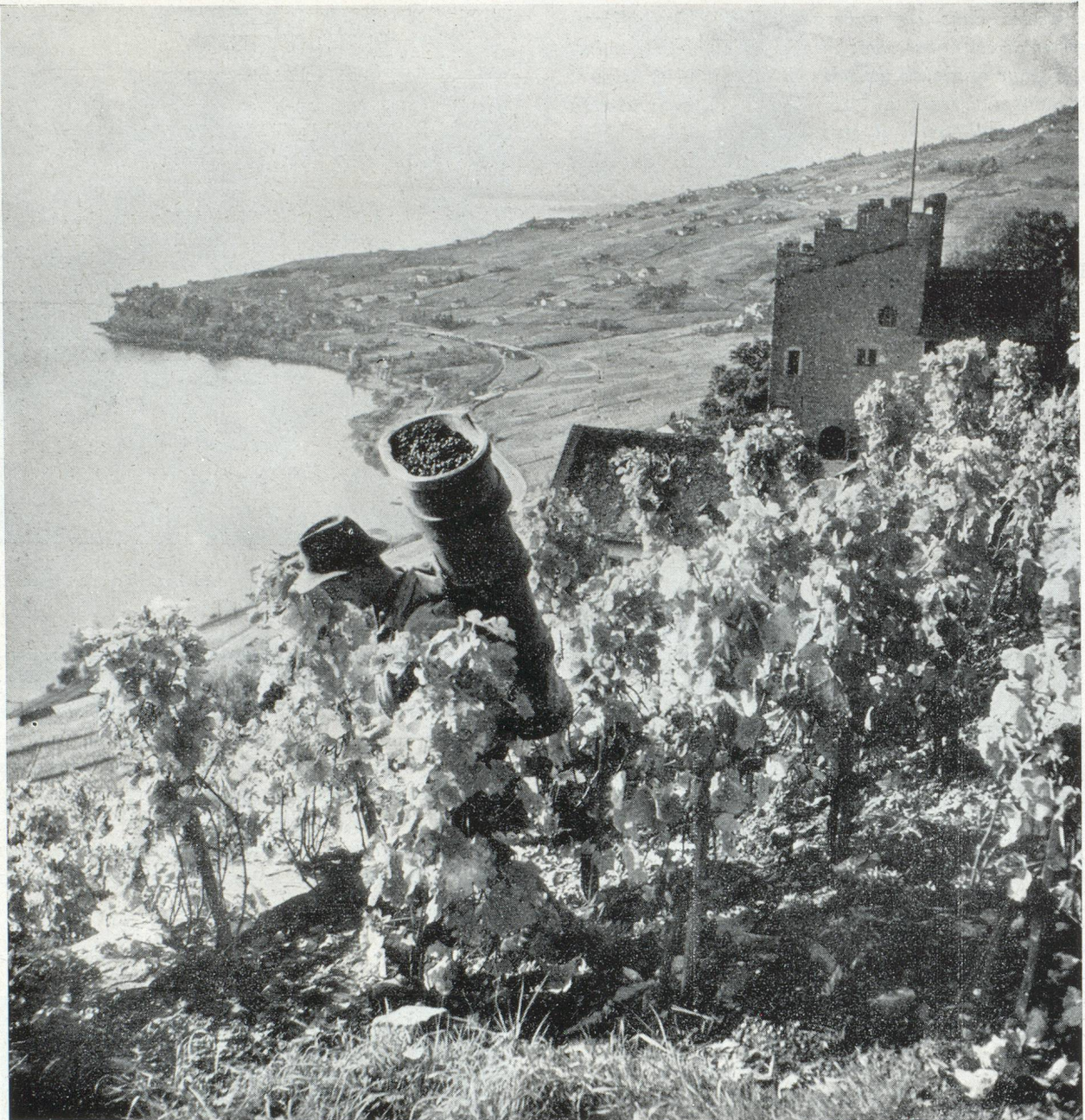
Vignobles du Lavaux