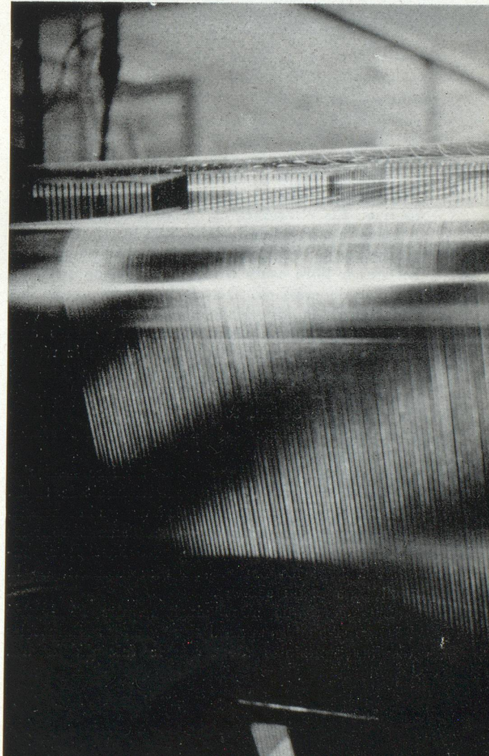
Les fils constituant la trame se déroulent régulièrement ; la rupture d'un de ces fils provoque l'arrêt automatique du métier à tisser

Plus axée sur le marché intérieur, la filature de laine cardée française, équipée de 745.000 broches rajeunie par une technique moderne qui a permis simultanément l'abaissement des prix de revient et l'accroissement de la régularité et de la résistance, reste l'une des bases essentielles des industries du vêtement et du sous-vêtement. Moins concentrée géographiquement, et d'ailleurs très souvent intégrée au tissage, elle alimente les métiers de Roubaix-