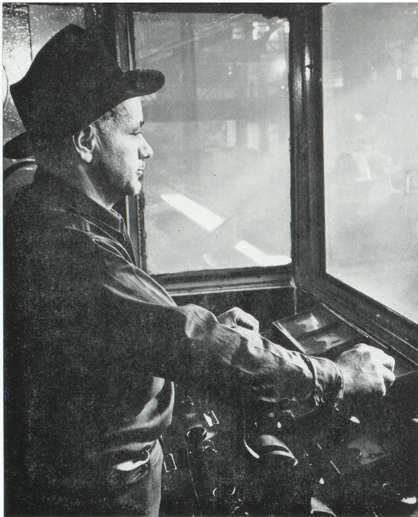
L'automation dans l'industrie américaine. Dans cette aciérie, un opérateur contrôle de son pupitre le mouvement des barres d'acier qui passent dans les laminoirs

l'automation, il faut mentionner certains facteurs généraux qui donneront à l'automation un caractère d'évolution et non pas de révolution industrielle. En effet, cette évolution se fera suffisamment lentement pour en prévoir, dans une certaine mesure, les conséquences, grâce à l'expérience, à des recherches et à des enquêtes préalables. Il est certain que les usines « presse-boutons » n'existent pas et ne pourront se réaliser que graduellement, notamment pour les raisons suivantes :