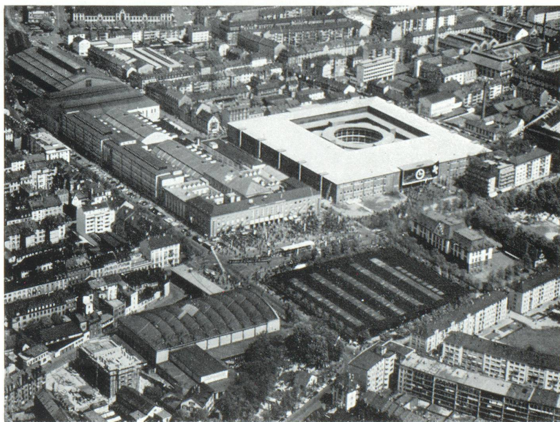
Vue aérienne des bâtiments de la Foire suisse d'échantillons de Bâle. Surface : 125.000 m 2 , 21 halles

Or, ce caractère spécifique de la production suisse se reflète d'autant mieux à la Foire de Bâle qu'elle réunit une offre particulièrement homogène dans chacun des divers groupes qui la composent. La qualité du travail suisse — dont nous ne tirons d'ailleurs nulle vanité puisque, comme nous l'avons démontré, il dérive de la nature même des choses — a donc pour corollaire le maintien du caractère national de cette manifestation. En y introduisant des éléments étrangers, nous risquerions de détruire l'unité de la présentation. Nous ne contestons pas que la présence de produits étrangers pourrait agir tel un principe d'émulation sur les industries du pays. Mais y a-t-il un avantage plus grand à réunir une