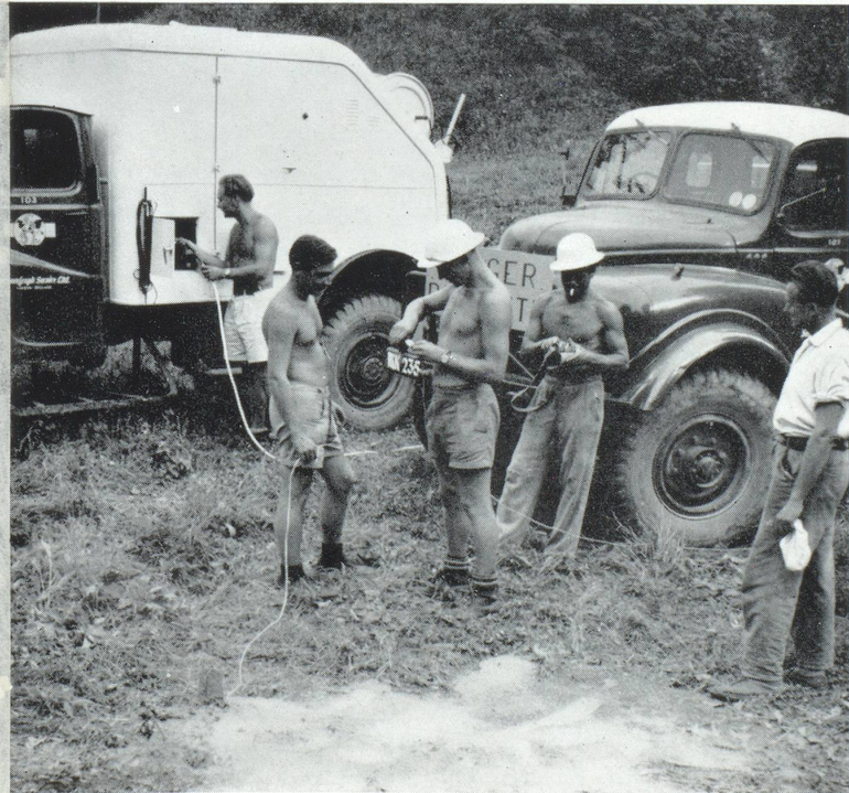
Recherches sismiques au Tessin

Le canton de Berne ne semble pas vouloir ratifier le concordat qui englobe les cantons du nord-est de la Suisse; cette attitude a créé de ce fait une région étendue et intéressante au point de vue géologique qui n'est pas encore attribuée à une société. Pour cette raison quelques grandes compagnies internationales (l'ESSO et la SOCONY-MOBIL) ont présenté des demandes à côté de celles de la Middleland Oil Co, du groupe Kopp-Gutzwiller et de la M. O. F. A. G. A Bâle-Campagne une révision de la loi sur les mines est en cours et l'examen éventuel de demandes de concession a été renvoyé jusqu'à l'adoption de cette loi.