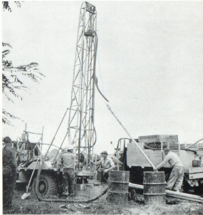
Forages pour des recherches sismiques dans le canton de Genève