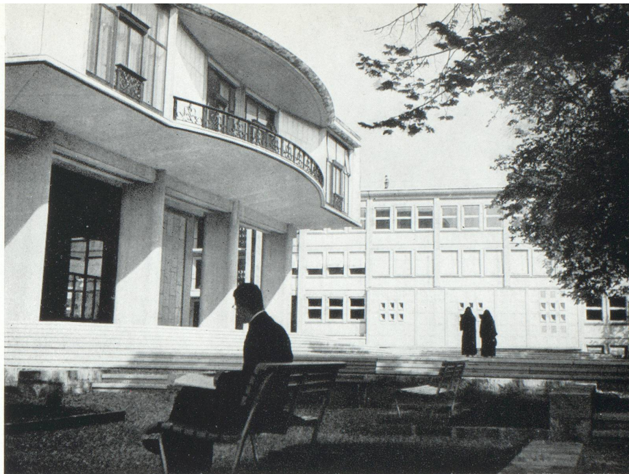
L'Université de Fribourg.

Car je reviens à mon voyageur. Que voit-il bientôt, d'aussi frappant que ces prés-pâtures, où les fleurs de Dieu l'emportaient sur la rationalisation? Il y voit une petite maison, toujours la même, et combien éloignée de la ferme vaudoise cossue, assise avec importance et la certitude de son bon droit, comme une grosse poule qui couve. Combien éloignée aussi de la ferme bernoise monumentale, qui (si ces mots pouvaient aller ensemble) serait la manifestation d'une industrie de la campagne, une usine rurale.