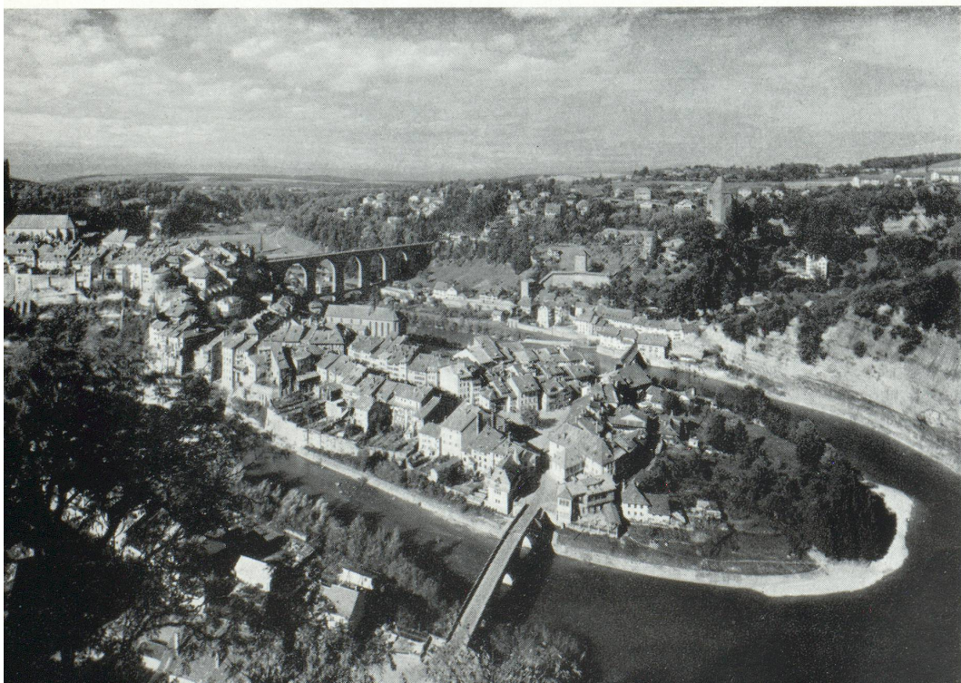
Fribourg, ville encerclée par la Sarine.

Voici peu d'années (vous comprendrez mieux que ce n'est pas une imagination de poète qui parle), voici peu d'années, les blés ensachés eurent une maladie, bénigne, mais gênante. Ou si c'était déjà au moment du battage. Il fallut que les spécialistes se penchent sur le problème : le blé donnait au paysan qui le maniait une curieuse bronchite avec très forte fièvre. Finalement on s'avisa que le type de la ferme fribourgeoise était défavorable au blé : c'était — c'est — une ferme à foin, à regain, à paille, à bétail. Ainsi, parfois, la science justifie la poésie.