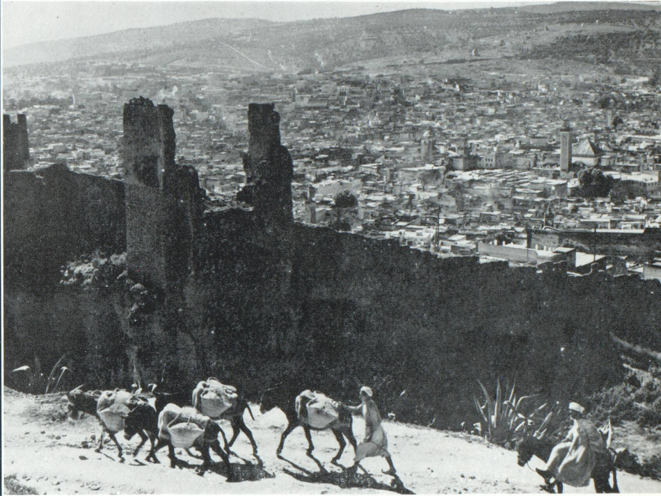
Fès, telle qu'on la découvre de la route qui ceinture la ville, à la hauteur des Tombeaux Mérinides, est l'un des plus beaux sites du monde