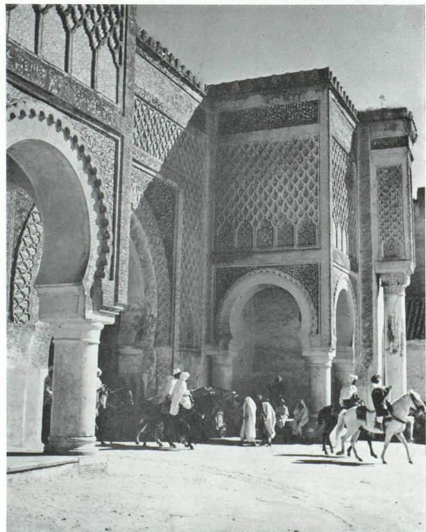
Bab Mansour, l'une des portes monumentales de l'enceinte de Meknès, est décorée de céramiques vertes (XVII e siècle)