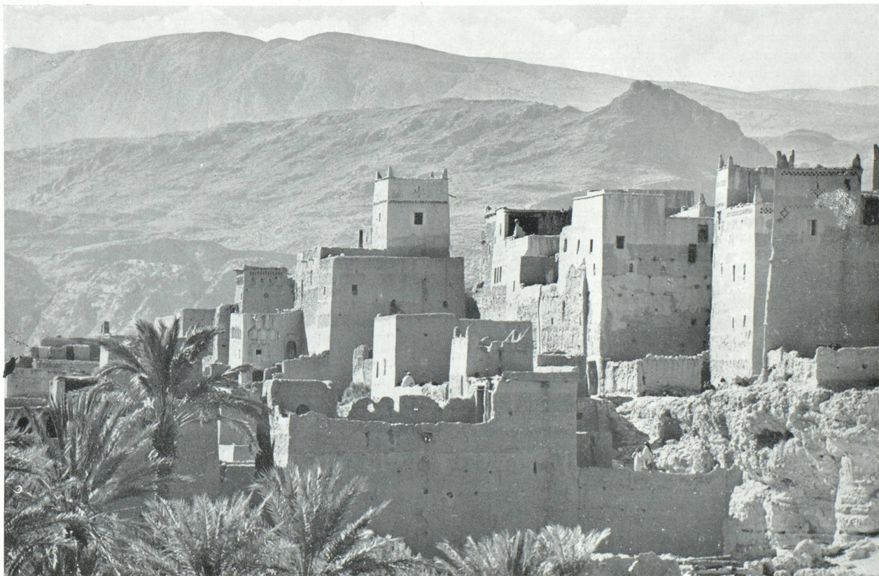
Tinerkir : Kasbahs dans la vallée du Todra (versant sud de l'Atlas)