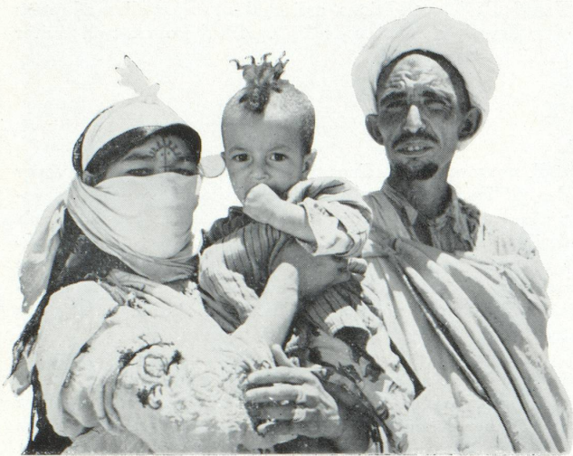
Famille berbère

Le barrage, voilà la solution. Il fournit à la fois l'énergie indispensable à l'équipement industriel du pays et permet d'irriguer de nouveaux territoires, fixant au sol les nomades, fertilisant le désert. Les Français ont commencé cette œuvre et les Marocains désirent intensifier ce programme.