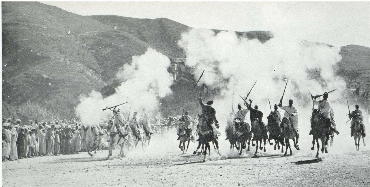
Fantasia au moussem (fête religieuse) de Moulay Idriss