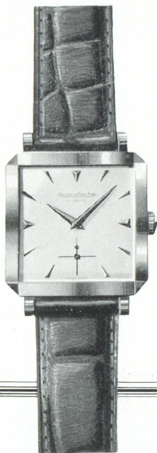
10. CA. 1