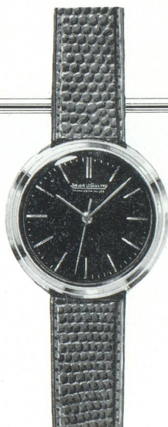
10. R. SC. 6