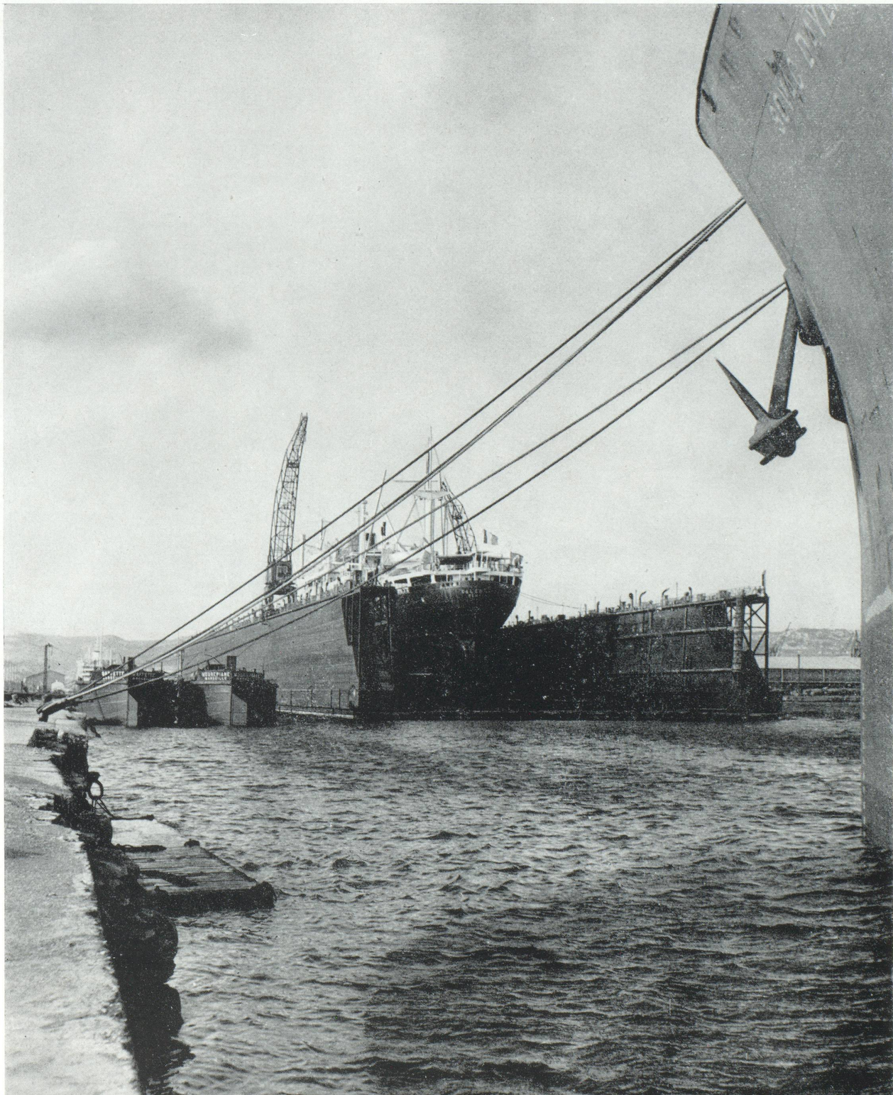
Navire en réparation sur le dock flottant de 40.000 tonnes.

Après la construction de toute une série de hangars modernes sur