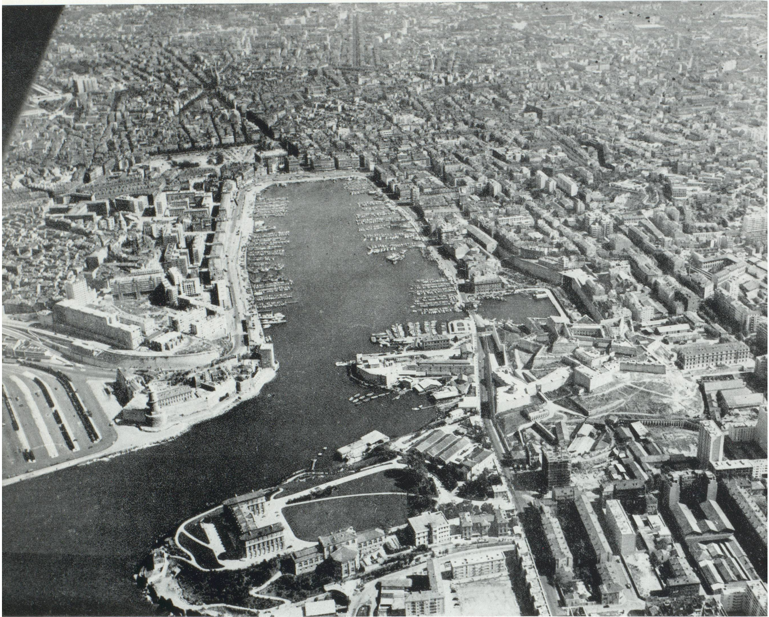
Vue aérienne de Marseille et du Vieux Port.

les différents môles des bassins Président-Wilson et Mirabeau, après le rescindement de la culée nord du pont Wilson, qui a permis la construction d'un quai rectiligne de 750 mètres en eau profonde, après l'allongement sur 650 mètres de la digue du Large, le Service maritime des Ponts et Chaussées procède à l'achèvement sur 1.000 mètres du quai de Mourepiane, qui délimite les terre-pleins réalisés sur 40 hectares, grâce au comblement d'une partie du bassin Mirabeau.