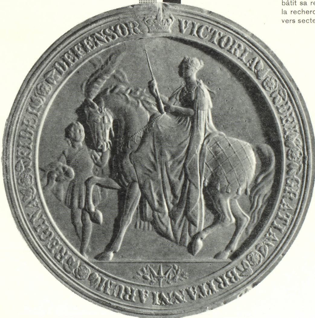
Sceau apposé sur un brevet anglais datant de 1868

Fidèle à une longue tradition, CIBA bâtit sa renommée sur les succès de la recherche scientifique dans les divers secteurs de son activité.