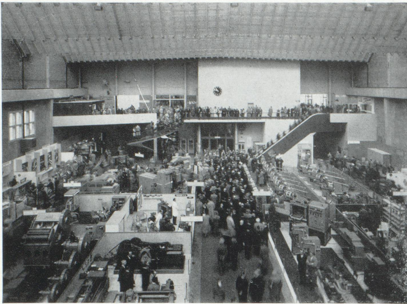
La dernière en date des halles de la Foire Suisse d'Échantillons de Bâle, réservée en 1958 aux machines-outils, abritera en 1959 une section de manutention rationnelle.

haute qualité. Aussi nous refusons-nous à envisager l'éventualité d'un renversement complet des situations acquises, cimentées par les courants d'échanges, d'ailleurs tant intellectuels qu'économiques, qui se sont multipliés au cours des siècles entre nos deux pays. Il n'en reste pas moins que dans la situation présente on s'observe de part et d'autre de la frontière. La Suisse, dans la ligne de sa politique commerciale qui a toujours été marquée de prudence, a adopté une position d'attente. A vues humaines, ce n'est, en effet, que dans un ou deux mois que le nouvel essai d'intégration européenne commencera à faire véritablement sentir ses effets. Si d'ici là le Marché Commun n'est pas complété par un arrangement « zone de libre échange » ou un arrangement équivalent, la position de la Suisse et des autres pays européens qui ne font pas partie de la Communauté économique européenne deviendrait certainement difficile.