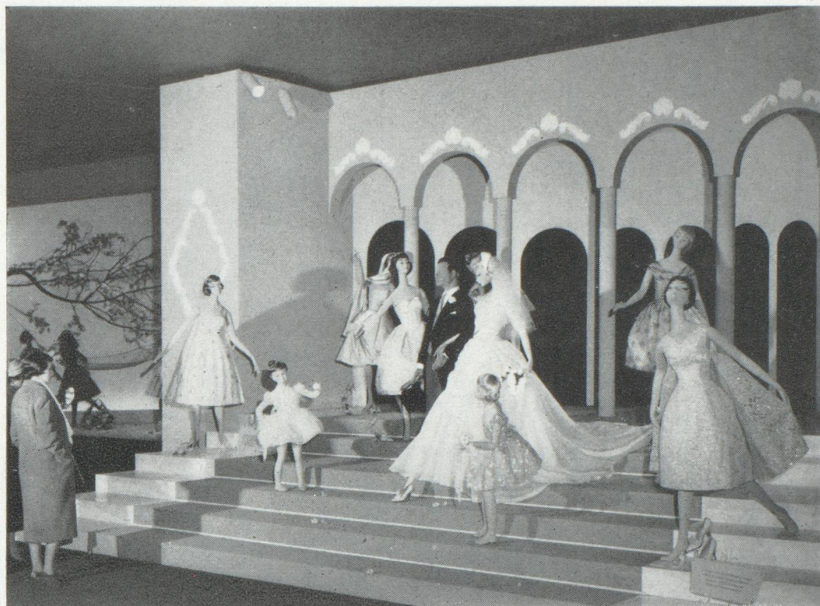
Le cortège de la mariée, point de mire du pavillon « Madame-Monsieur » à la Foire Suisse d'Échantillons de Bâle.

Dans la grande halle aux machines tout un groupe d'entreprises de grosse construction mécanique, de