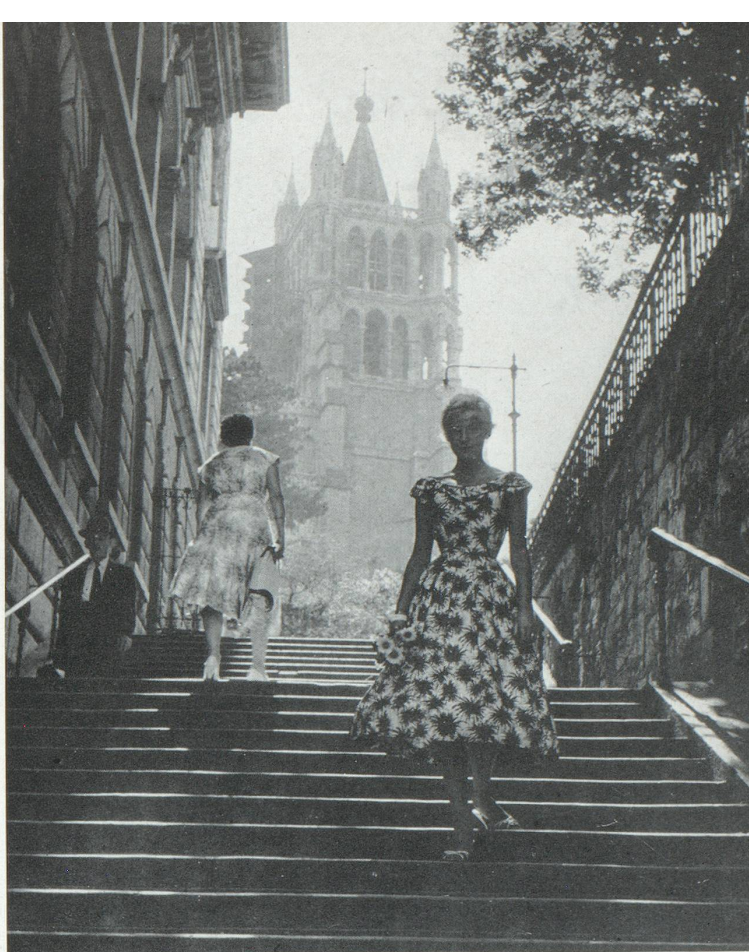
La cathédrale de Lausanne

Les hôteliers suisses, comme tous leurs collègues européens, sont actuellement en butte à des tentatives fort pressantes de la part de certaines organisations de crédit américaines qui voudraient introduire en Europe leur système de cartes de crédit en mettant à la charge des hôteliers les frais qu'occasionnent de telles opérations. Bien que le crédit ne soit pas encore entré dans les mœurs des touristes du vieux continent, l'hôtellerie ne voudrait pas s'opposer au principe même d'un système qui peut éventuellement rendre service à la clientèle d'outre-Atlantique. Mais, fidèle aux principes en vigueur dans