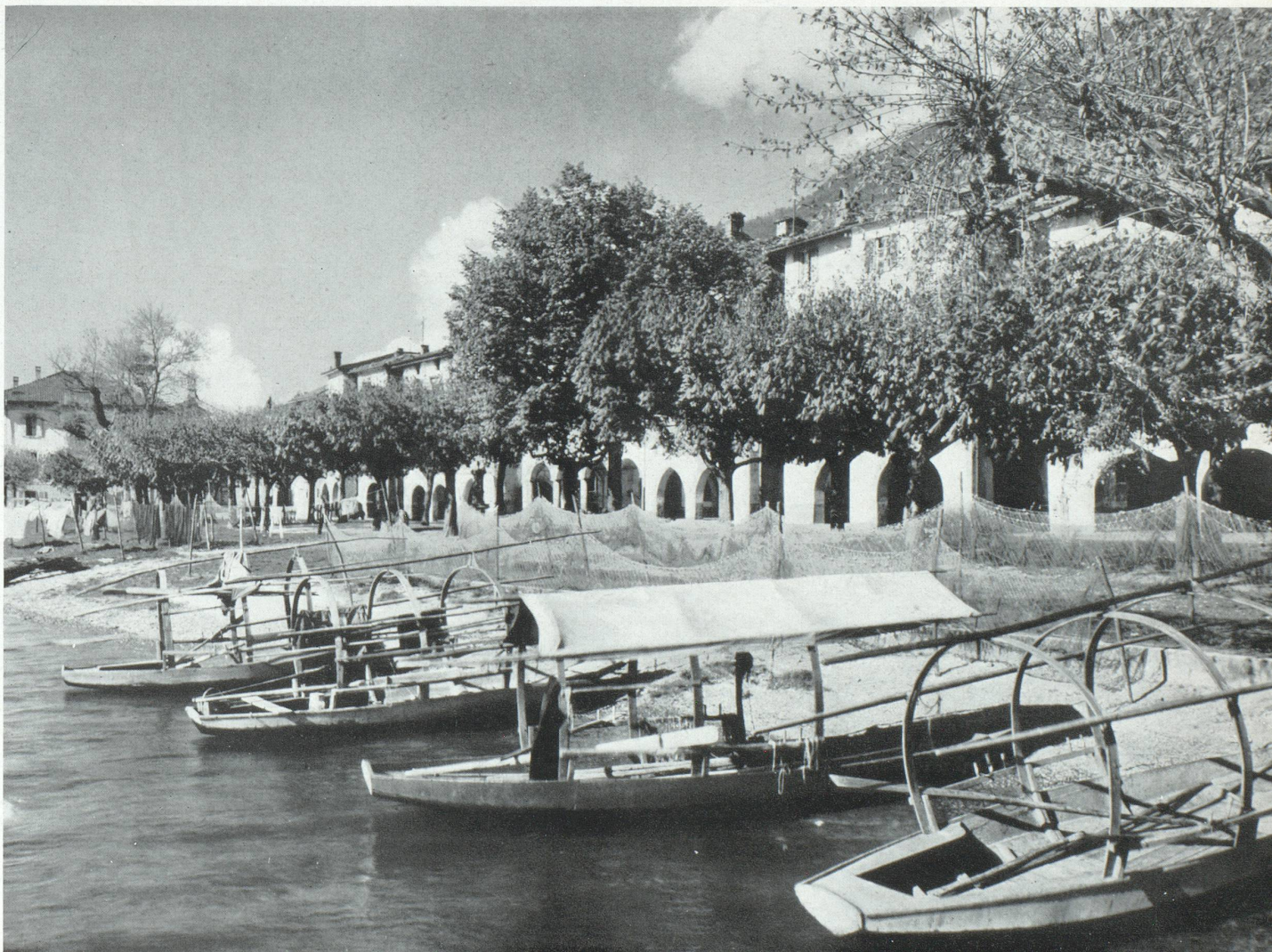
Bissone, près de Lugano

Si l'hôtellerie suisse n'a pas eu à sa disposition les vastes capitaux qu'implique l'installation dans un hôtel des derniers raffinements de la technique — et là encore, il ne faut pas généraliser, puisque certains établissements ont tout de même réussi à le faire — l'hôtelier suisse s'est efforcé de compenser certaines lacunes ou imperfections techniques et esthétiques qui existent encore ici et là en conservant à leurs maisons un cachet et une atmosphère particulière qui en font le charme. Ils savent que, sans atmosphère, un hôtel est sans âme et que c'est surtout la qualité des prestations et des services qui constitue cette ambiance indéfinissable dans laquelle la clientèle se plaît à vivre. Alors que la technique pure menace de tout contaminer, le fait d'accorder une attention spéciale au côté humain et au caractère personnel des hôtes est d'une importance que l'on ne saurait surestimer pour le bien-être de la clientèle. Cette valeur morale est un complément indispensable du confort moderne et nous devons faire l'impossible pour la conserver. Nous