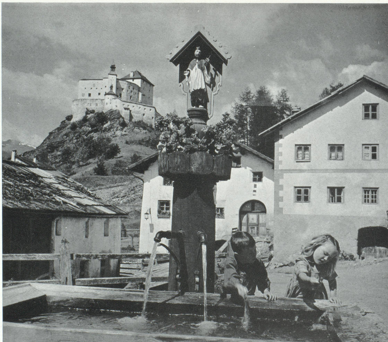
Schuls et le château de Tarasp, dans les Grisons

Si les répercussions de l'intégration européenne peuvent être capitales pour le tourisme et l'hôtellerie suisses, notre industrie n'en a pas moins des problèmes plus immédiats à résoudre. Le premier est celui de la rentabilité des établissements, rentabilité qui est notablement insuffisante dans l'hôtellerie saisonnière spécialement. Les experts estiment qu'un taux moyen d'occupation de 60 à 70 % est nécessaire pour qu'un hôtel puisse faire face à ses obligations. Les taux moyens d'occupation de l'hôtellerie suisse que nous avons cités plus haut, montrent bien que nous sommes encore fort loin de compte. Certes, quelques hôtels qui travaillent toute l'année, dans les villes surtout, ont pu réaliser d'excellentes affaires. Pourtant le taux moyen des divi-