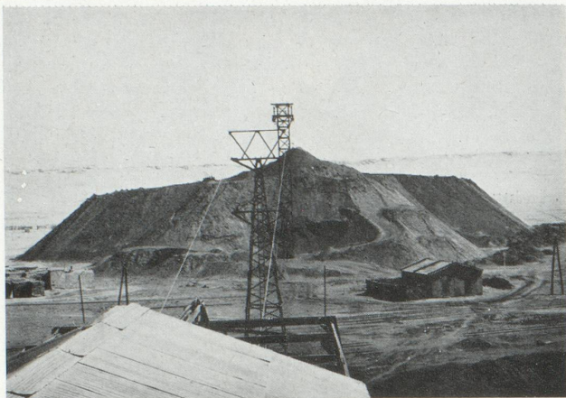
Les charbonnages de Kénadza