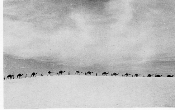
Caravane de méharistes