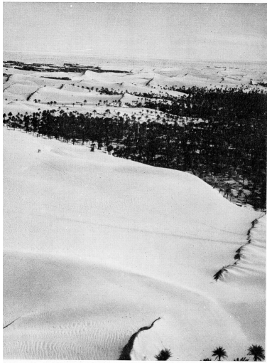
Les dunes sableuses menacent les palmerales

Berbères se convertissent au Christianisme. Après Saint-Cyprien, Saint-Augustin établit fortement l'Église d'Afrique. Miné par des luttes intestines de Rome, l'Empire d'Occident fléchit sous le poids des vandales de Genséric et l'anarchie s'installe au Maghreb. Au VII e siècle, les guerriers arabes introduisent la loi de l'Islam, mais il leur faut s'imposer « par le fer et par le feu » suivant la parole de l'historien Ibn Kaldoun.