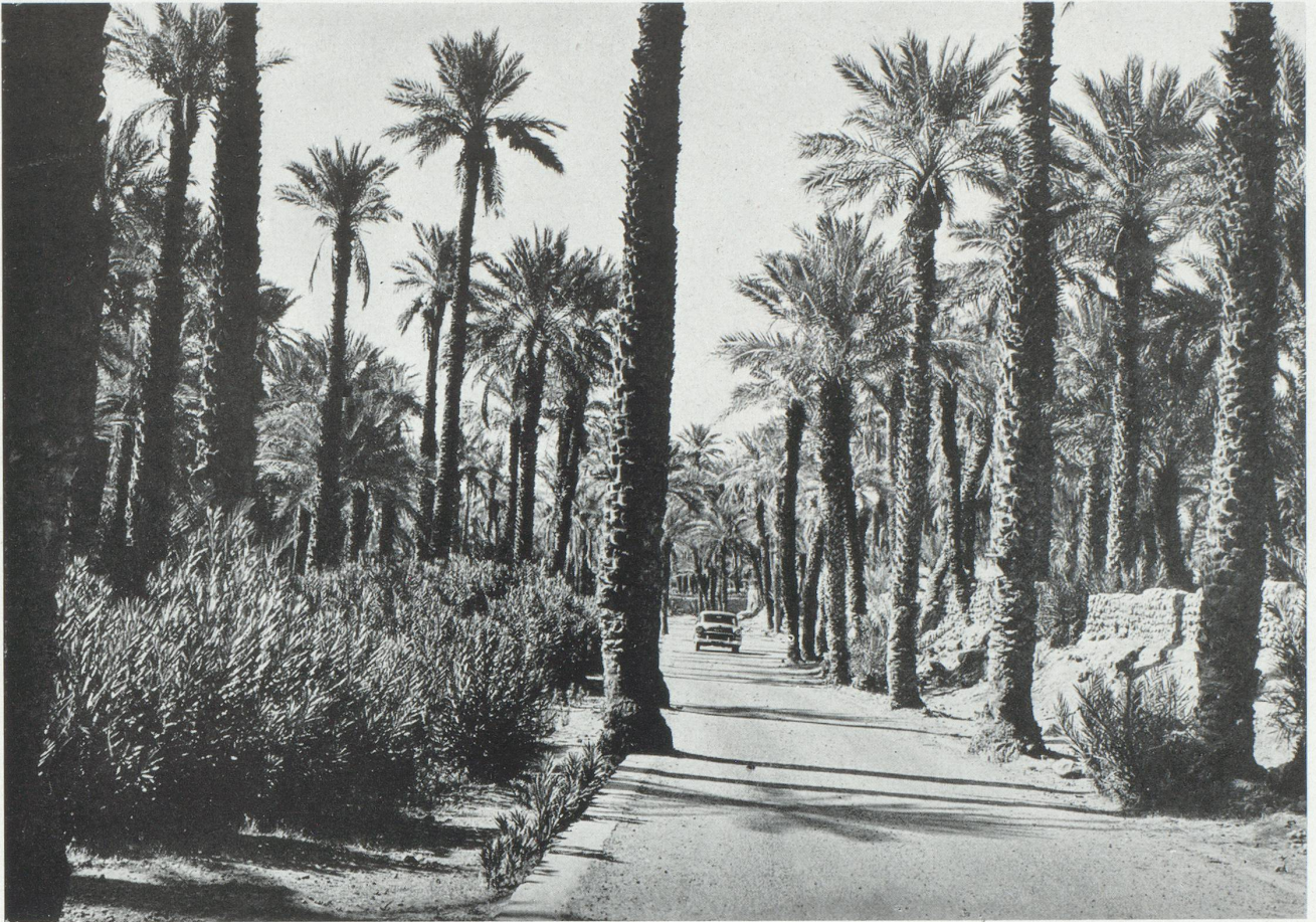
La piste de l'oued Zousfana à Taghit