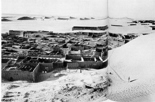
Vieux quartier d'In Salah envahi par le sable

Pour les Arabes, le désert commence « là où la terre