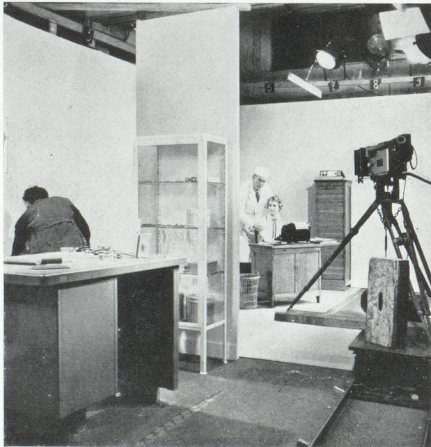
Photo extraite du film « Position dangereuse » réalisé par Jean Mineur pour la machine à écrire Hermès

On constate par ailleurs que la qualité des films est pour beaucoup dans le succès de cette forme de publicité.