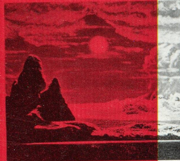
RIEN POUR LES VIVRES, Cuba, Kiboneso, montagne d'Altiplano, sous l'arcade des Volcans, sous les cieux d'Altiplano et d'Andes. Le ciel bleu est le plus clair du monde. Les couleurs du paysage sont d'une intensité et d'une variété qui n'ont pas d'équivalent ailleurs. Les couleurs du ciel sont d'une intensité et d'une variété qui n'ont pas d'équivalent ailleurs.