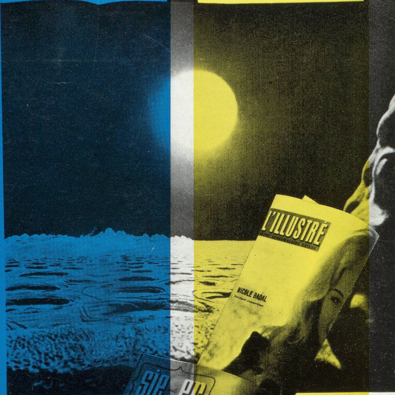
PAYSAGE DE PLOMB SUR MÉRIDIEN