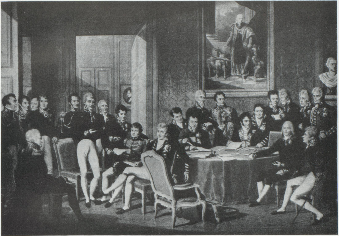
Une séance du Congrès de Vienne (1815), où la neutralité de la Suisse fut reconnue par les grandes puissances. A l'extrême gauche : Wellington ; le 7 e à partir de la gauche : Metternich ; tout à droite, le bras posé sur la table : Talleyrand (d'après un tableau de J. Isabey)

tibles avec ses intérêts généraux, jusqu'au point précis où l'exercice futur, toujours réservé, du droit de neutralité s'en trouverait compromis.