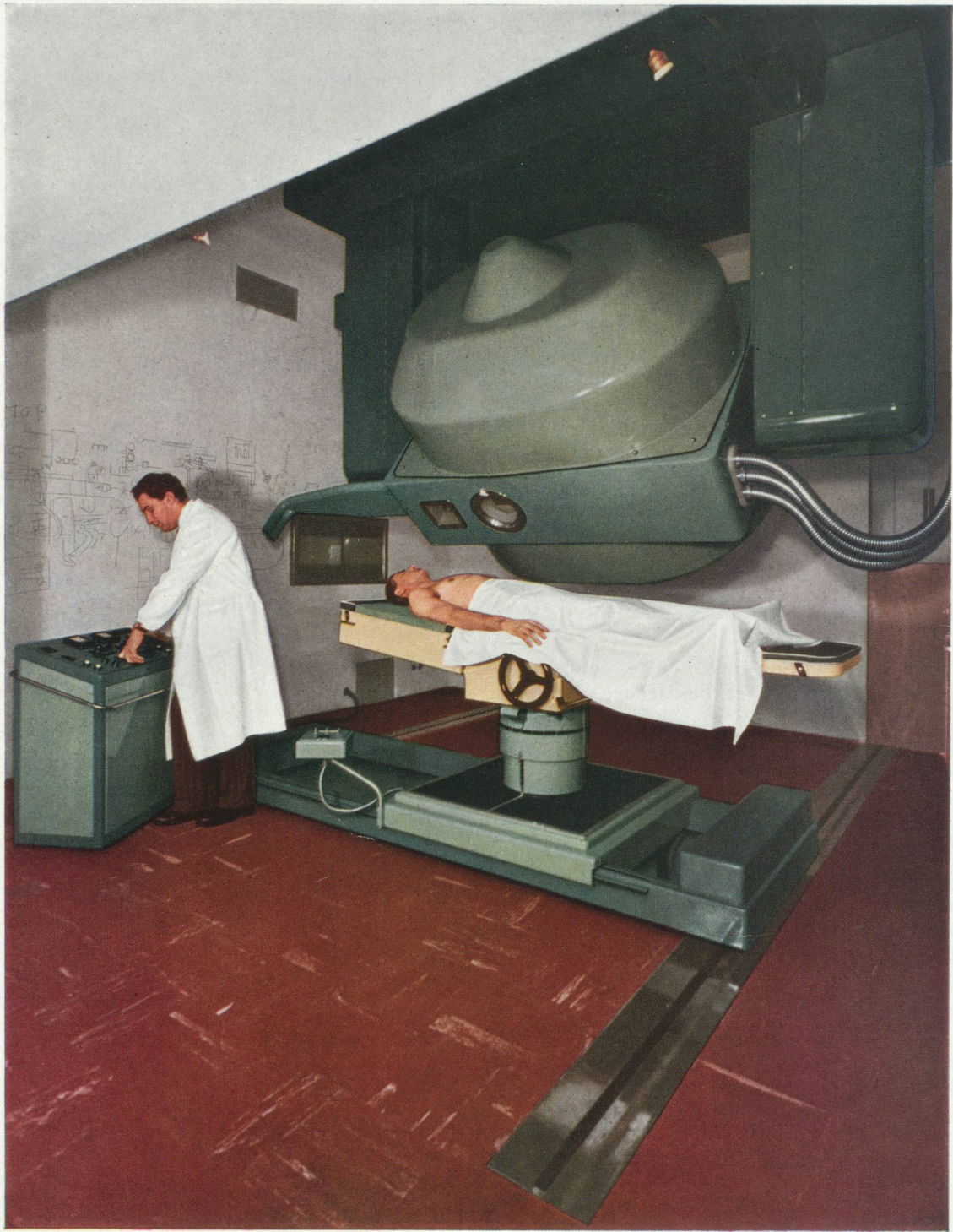
La clinique Saint-Ambroise de Milan est équipée d'un asclépitron Brown Boveri de 31 MeV. L'asclépitron est un béatatron orientable spécialement conçu pour la radiothérapie. Il peut produire soit un faisceau de rayons X de 31 MeV, soit un faisceau d'électrons de 30 MeV. Il est complété par un tube à rayons X de 125 keV, pour le diagnostic, et par une table d'exposition dont la position est réglable à l'aide de servo-moteurs.