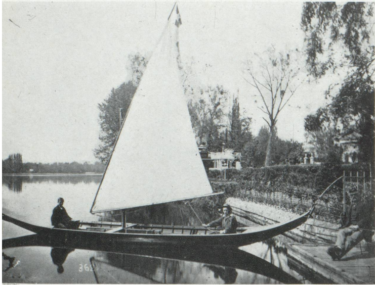
Calme d'autrefois... (Photo Roger Viollet.)

crera à ses loisirs un temps et des ressources que ses ancêtres n'auraient pas même osé imaginer.