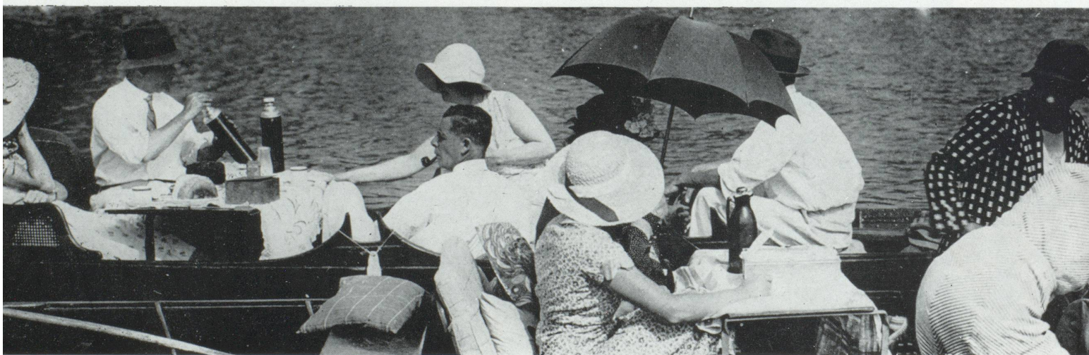
Les loisirs ne concernent plus seulement un petit lot de privilégiés.

Est-il au demeurant souhaitable? L'Occident n'a-t-il vraiment rien d'autre à offrir aux générations futures