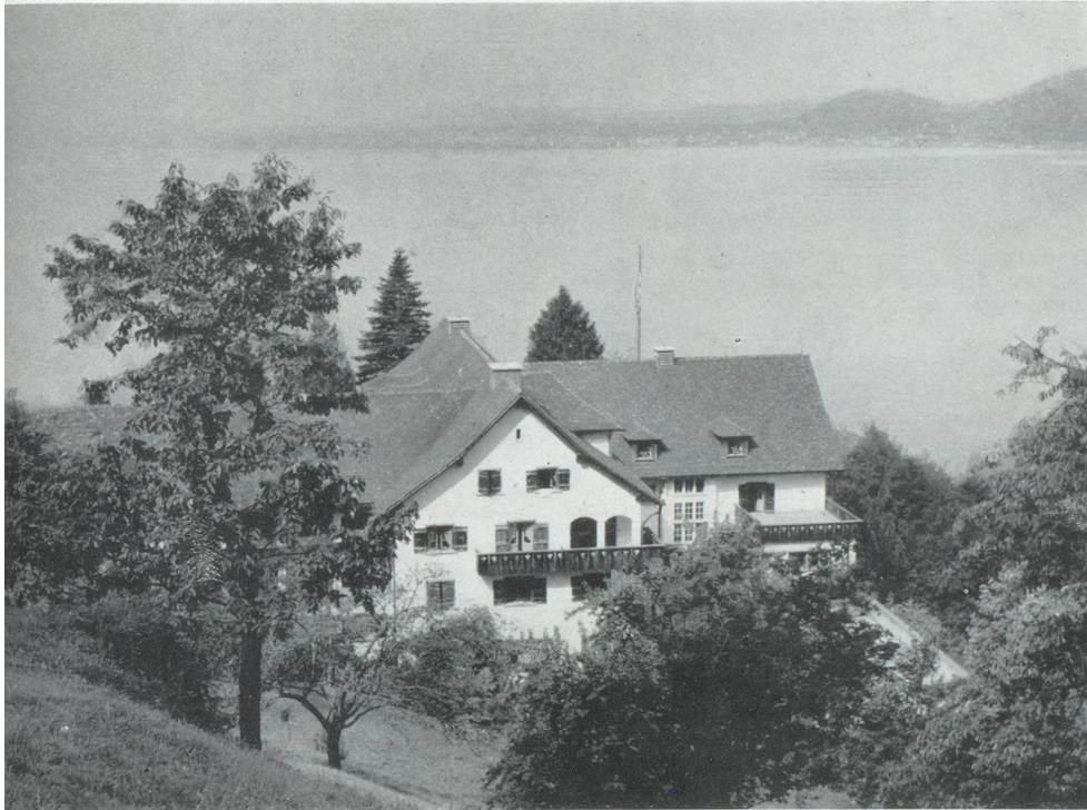
La Maison de vacances de la FOMH à Vitznau (Lac des Quatre Cantons) accueille dans une centaine de chambres spacieuses et bien meublées les travailleurs de la métallurgie et de l'horlogerie en vacances.

loppement professionnel qui ne s'arrêtent pas, dans ces métiers uniquement à la technique.