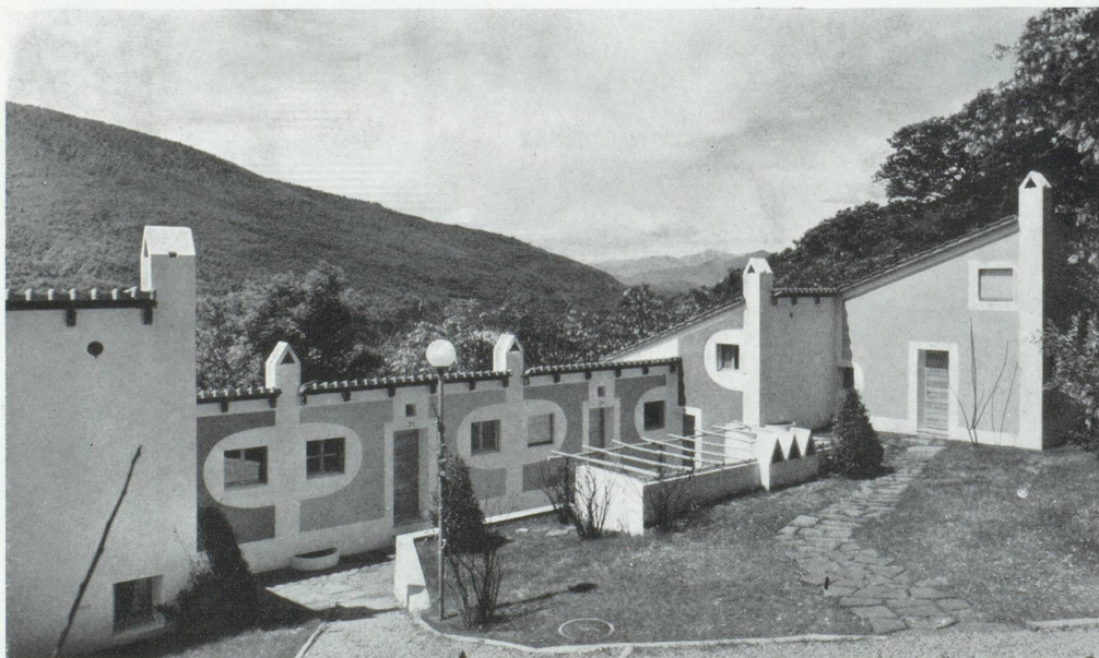
La vie familiale est sauvegardée dans la communauté de Sessa au Tessin..