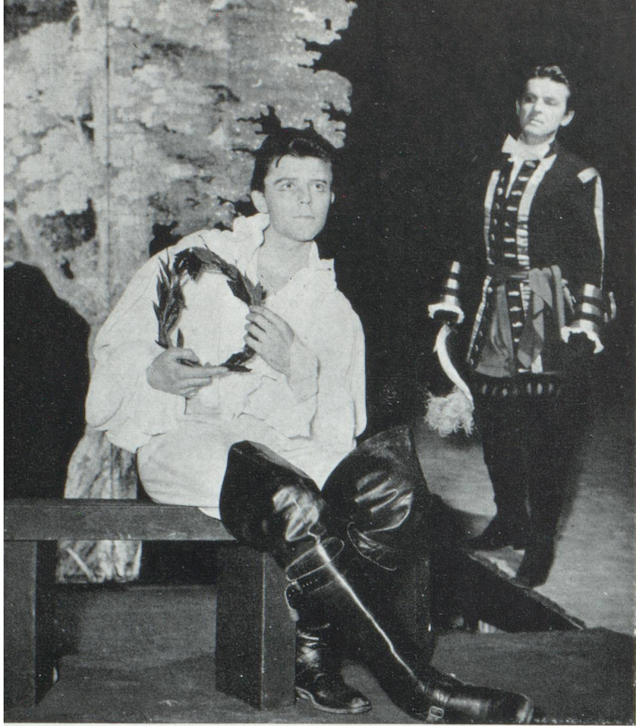
Gérard Philipe dans « Le Prince de Hombourg » de Kleist.

Büchner, grands romantiques allemands, mais je n'ai pas ignoré, loin de là, Hugo ni Musset, grands romantiques français. « La Mort de Danton », de Büchner, nous intéresse particulièrement puisqu'elle traite de la révolution de 93. Excepté la Comédie-Française, qui a joué Hugo en France depuis un siècle, compris Antoine, Gémier, le Cartel, etc ? Nous avons joué notre grand Hugo non pas seulement à Paris mais à New York, à Moscou, à Rome, à Londres, à Buenos-Aires, à Lénin-grad.