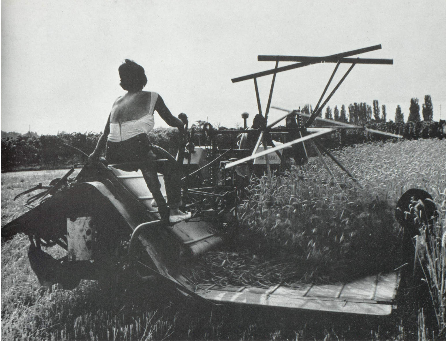
Travaux publics et agriculture : deux secteurs de l'économie où la main-d'œuvre étrangère joue un grand rôle en Suisse

Spirituellement, depuis des générations, la Suisse concilie à l'intérieur de ses frontières des populations de culture germanique, française, italienne. De leur diversité, elle tire une harmonie qui la remplit d'une légitime fierté, et elle se réjouit aujourd'hui de voir la France, l'Allemagne, l'Italie s'engager dans une voie qu'elle sait riche de promesses.