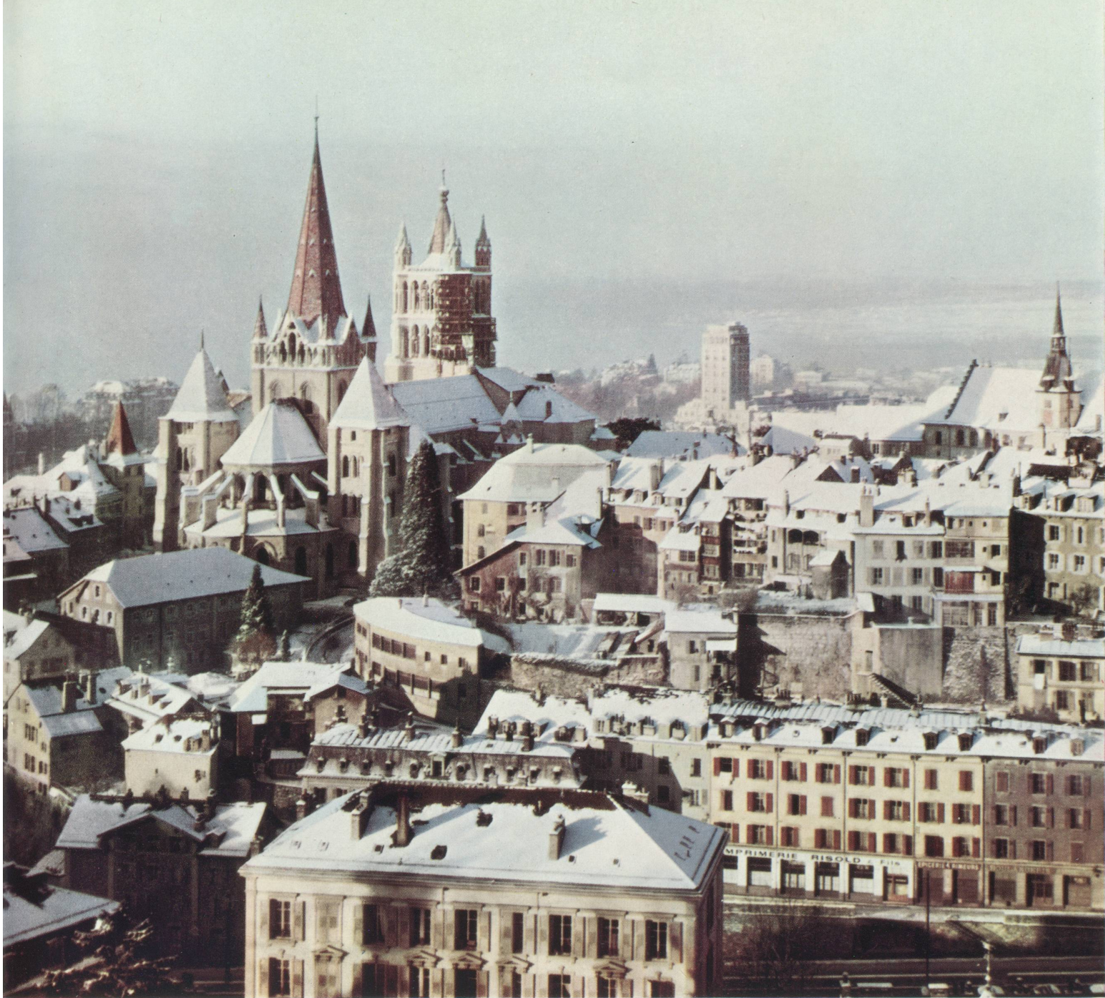
Lausanne sous la neige

cours du temps, sans rappeler même le Traité de Vienne qui considérait que la neutralité de la Suisse est « dans le véritable intérêt de l'Europe », parce qu'elle lui permettait d'être le lieu de rencontre de trois nations, parce qu'elle avait pour effet de placer hors des compétitions européennes les passages des Alpes, notons tout de même quelques faits de l'histoire contemporaine. Que ce soit en donnant sa caution d'objectivité et de sérénité à la Croix-Rouge, que ce soit en assumant en cas de rupture des relations diplomatiques et de guerre