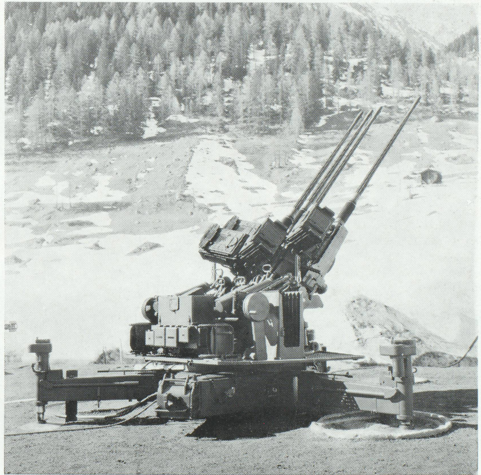
Batterie anti-aérienne Hispano-Suiza à Genève

Il ne fait pas de doute que le pays en retire un grand profit. La plupart des jeunes Suisses, tous ceux qui sont aptes au service, connaissent les exigences de la vie militaire. Entraînés à supporter les fatigues physiques, à s'accommoder d'une promiscuité parfois pénible et à se plier à une discipline sommaire, ils reviennent simplifiés et endurcis à la vie civile. Beaucoup assument des commandements, qui peuvent être très élevés, puisque même les régiments et les brigades sont confiés à des officiers de milice. Pour s'y préparer, ils suivent des cours spécialisés, mais