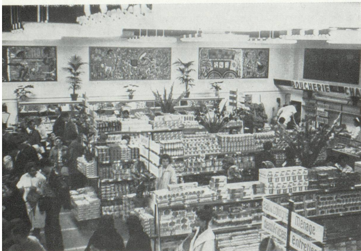
Le « GRO-CRISTAL ».

— La clientèle a réagi très favorablement. Les habitudes à prendre sont différentes. On fait son marché une fois par semaine. Les ventes doublent