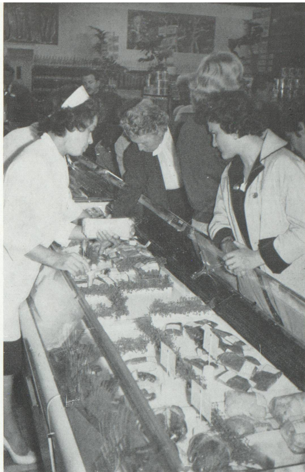
Le « rayon-viande » (une « gondole » de 4 mètres de longueur) qui, avec une conseillère, fait le chiffre d'affaires de 4 bouchers.

— Les frais généraux chez GRO sont sensiblement moitié moindres que ceux des Docks, parce que l'énormité du chiffre d'affaires noie les frais fixes. Au point de vue marge, le principe de base est de supprimer la marge de détail et de vivre sur la marge de gros. Le rabais est donc très différent suivant les articles; il est de 8 % sur l'huile de table mais va jusqu'à 30 % sur certains articles de droguerie ou de parfumerie. La totalité des articles est vendue à prix de gros. Il n'est pas question d'attirer la clientèle en « bradant » les grandes marques pour vendre ensuite des sous-marques de meilleur profit. C'est un système cohérent poussé jusqu'au bout de sa logique. Nous avons tout