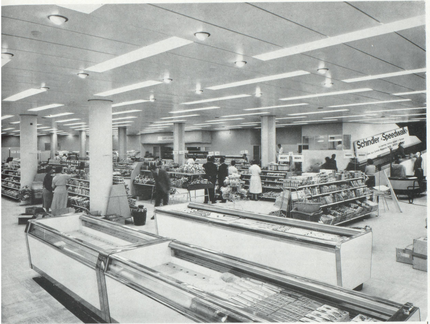
A l'intérieur du supermarché de l'Innovation. A droite : le premier trottoir roulant d'Europe.

— Au travers des chaînes et organisations d'achat, quelle est la part d'initiative réservée au directeur d'un grand magasin?