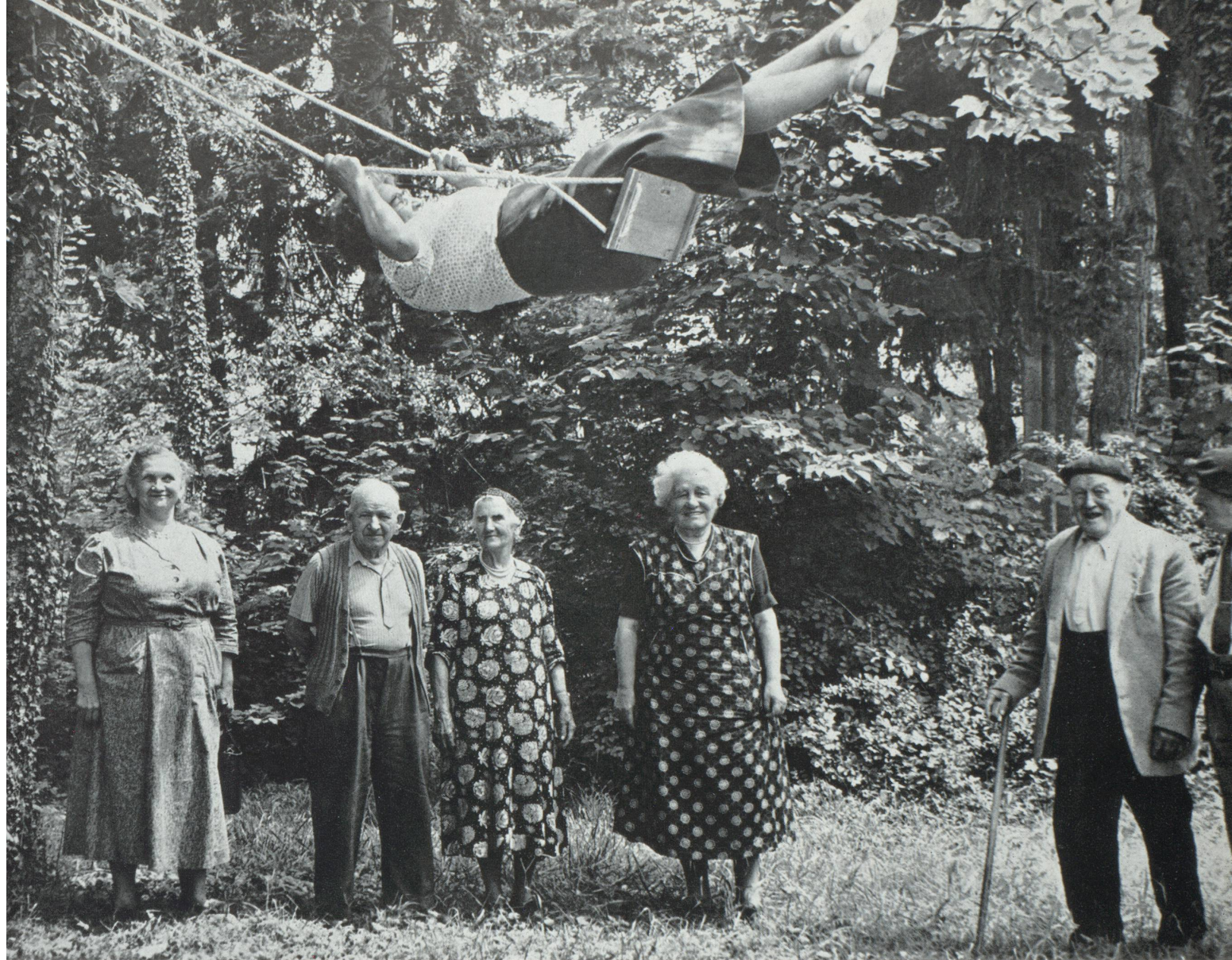
Il faut s'attendre à un sensible accroissement du nombre des personnes âgées... (Jean Mohr).

en matière de longévité, à un sensible accroissement du nombre des personnes âgées.