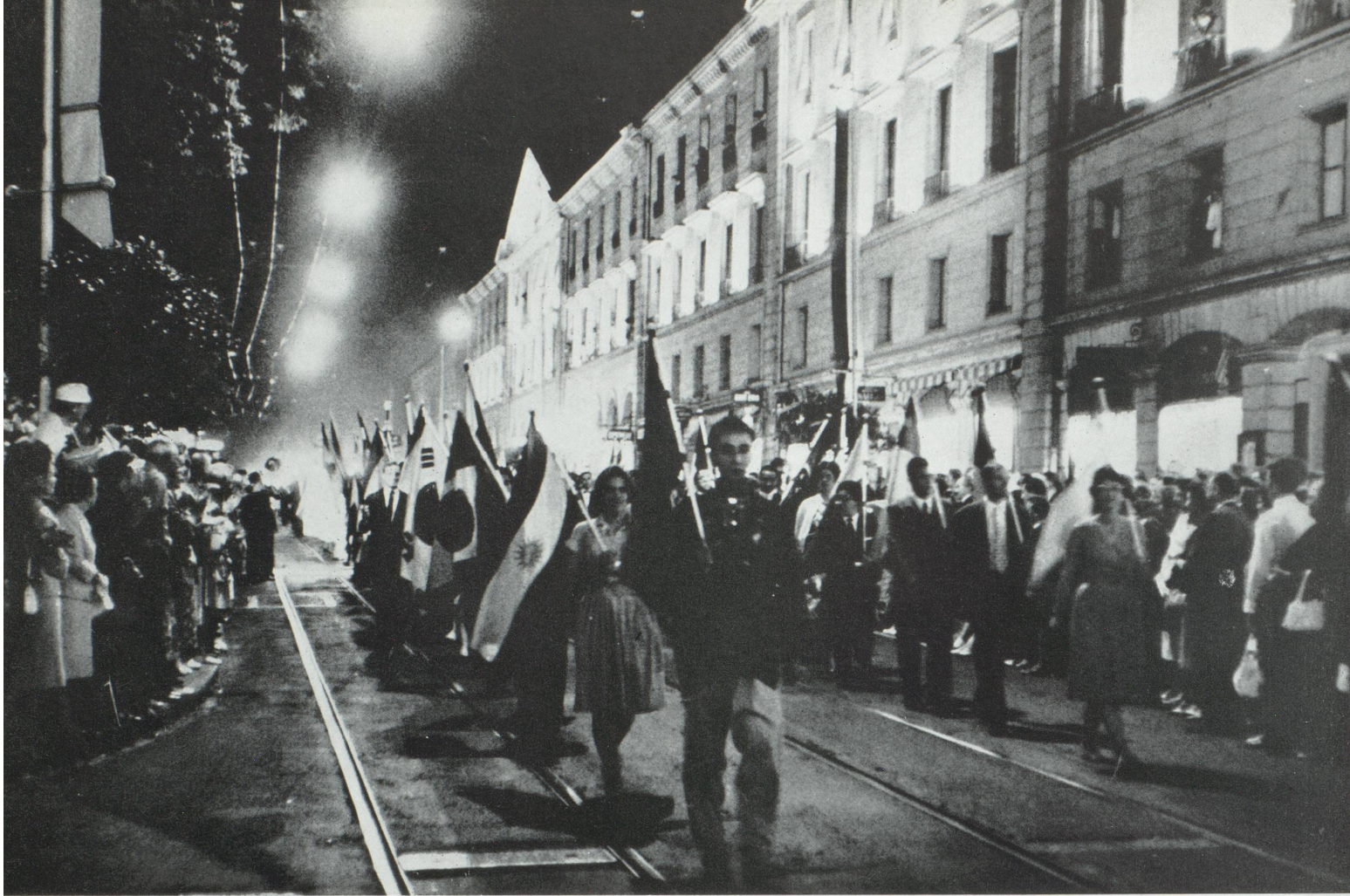
La Suisse accueille un grand nombre d'étudiants provenant de divers pays (Jean Mohr).

COMMENT LA SUISSE FAIT-ELLE FACE AU DÉVELOPPEMENT EXTRAORDINAIRE DE LA SCIENCE ET DE L'ÉCONOMIE? LE CLOISONNEMENT, PROVOQUÉ PAR LE FAIT QUE LES UNIVERSITÉS SONT CANTONALES, PERMET-IL A CHACUNE D'ENTRE ELLES DE DONNER TOUTES SES CHANCES A L'ÉTUDIANT? LA SUISSE SE MAINTIENNELLE AU NIVEAU DES AUTRES PAYS DÉVELOPPÉS DANS CE DOMAINE? EN TANT QUE DIRECTEUR D'UNE GRANDE ENTREPRISE, ESTIMEZ-VOUS LA SITUATION ACTUELLE SATISFAISANTE? COMMENT EST RÉSOLU, D'AUTRE PART, LE PROBLÈME DE LA FORMATION POST-UNIVERSITAIRE?