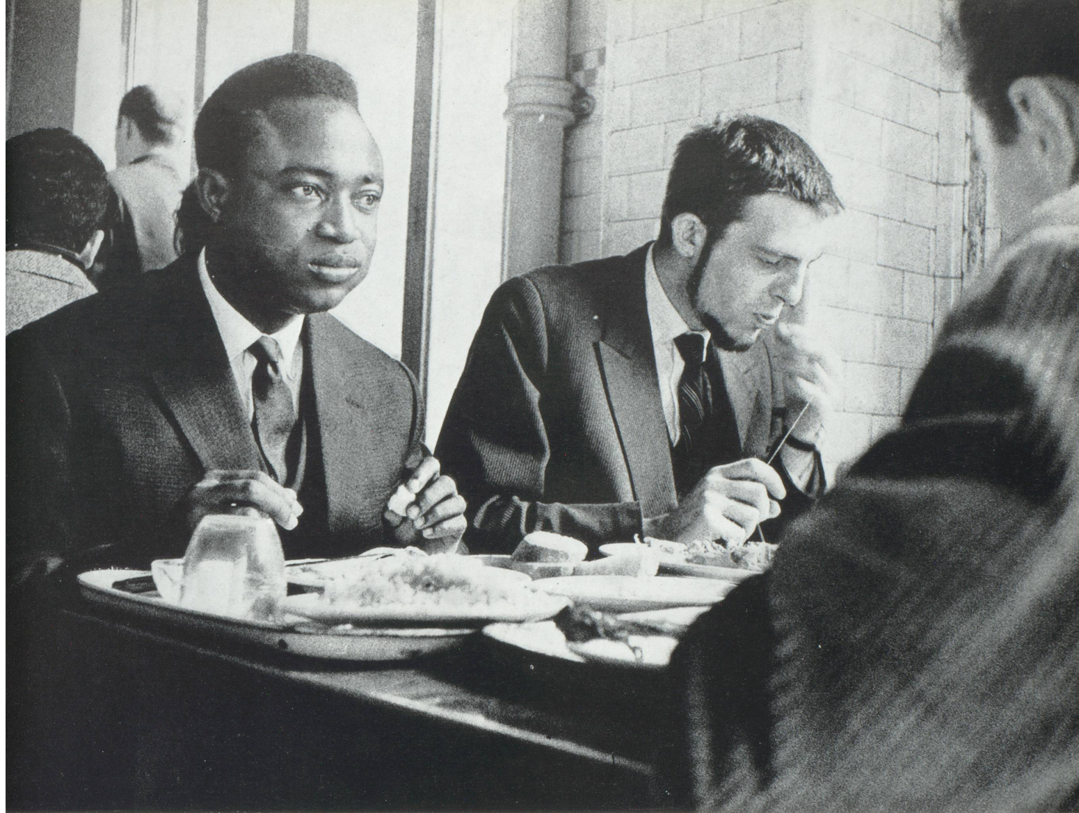
Boursier congolais à Lyon (Jean Mohr).

ils savent par expérience qu'une palabre doit, pour être efficace, se tenir dans un rayon de liberté suffisante. L'organisation des congrès mondiaux ou simplement entre deux continents laisse souvent à désirer.