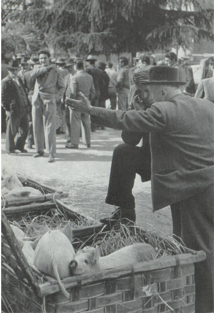
Il y a encore des réservoirs de main-d'œuvre. Ici un village italien.