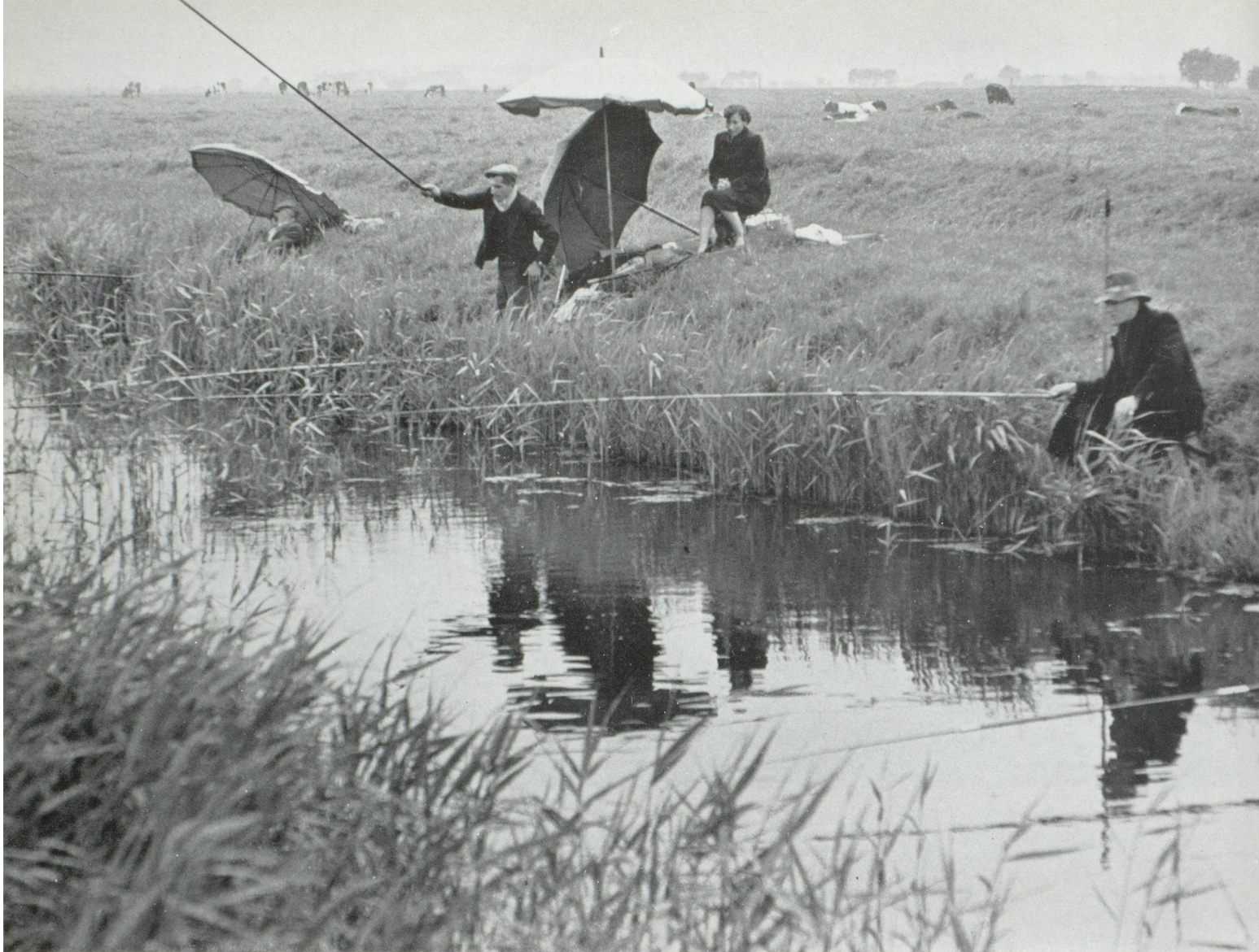
Le droit au travail, mais aussi le droit à la détente.

du travail, au droit syndical et aux négociations collectives entre employeurs et travailleurs.