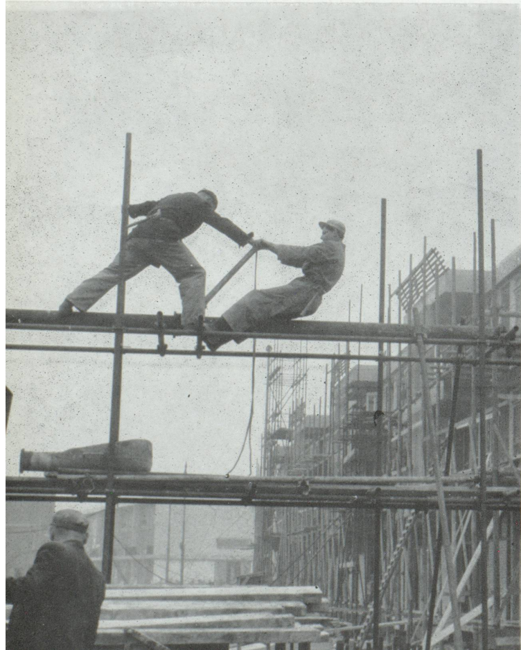
Chantier hollandais.