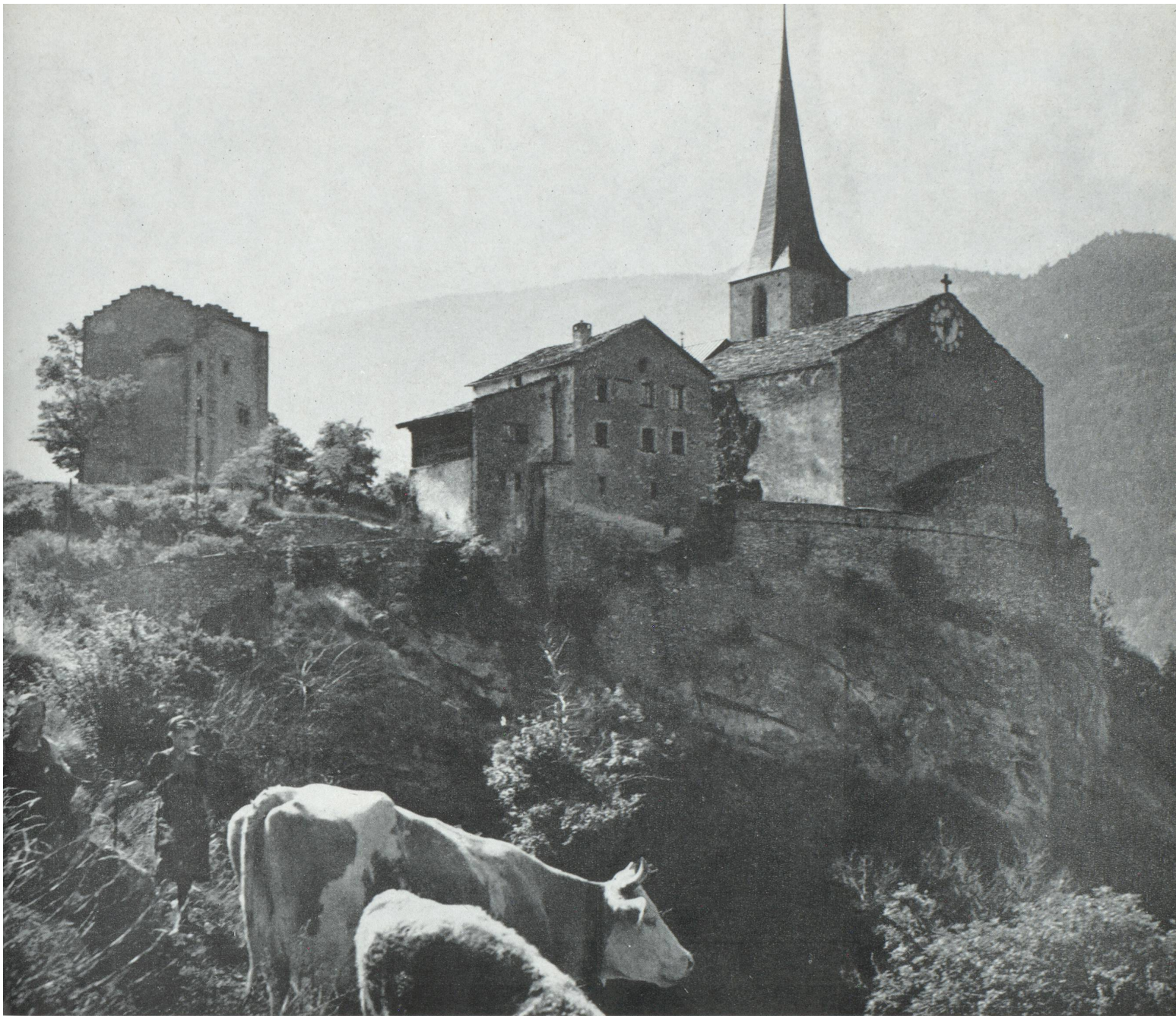
L'église de Rarogne à l'ombre de laquelle repose Rainer Maria Rilke.

ques pour les beautés naturelles, sans accroître le bruit et l'agitation? Cette interrogation est impérieuse dans un pays aussi petit que la Suisse, où toute atteinte au patrimoine est plus sensible qu'ailleurs. Comment intensifier le tourisme et faire en sorte que la Suisse demeure ce qu'elle est, qu'elle continue à offrir les particularités qui font son attrait?