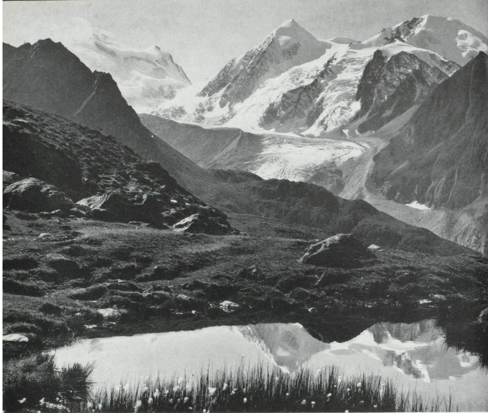
Le lac de Louvie en Volais, et le massif des Combins.

par contre, à éviter de suggérer que la Suisse est plus belle que d'autres pays, ou préférable; elle se borne tout simplement à montrer en quoi elle est différente, et essaie de contribuer à la compréhension entre les hommes. Son ambition se limite à présenter — évidemment de manière aussi plaisante que possible — les images d'une démocratie paisible, quotidienne et bonne ménagère, d'une beauté mêlée à la vie de chaque jour et des manières de vivre qui peuvent contribuer à ce bonheur auquel tous les hommes aspirent, sous toutes les latitudes.