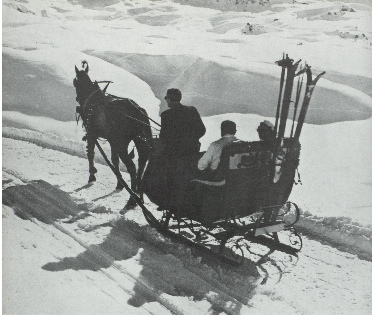
Départ pour les champs de ski en Engadine.

que la providence machine parfois, ces aspirations — qui sont dans l'air — se sont fait jour l'année du 25 e anniversaire de la naissance de J.-J. Rousseau. Le Citoyen de Genève — formé par nos paysages et par nos traditions — n'a-t-il pas accompli ce miracle de rendre le sentiment du naturel et de la nature à une société qui l'avait perdu? Ne pouvait-on pas dire dès lors, et sans forcer en rien la pensée, que cette constatation éclaire l'actualité du message de Jean-Jacques? En effet, dans une société où l'accent, qui est mis trop unilatéralement sur la tech-