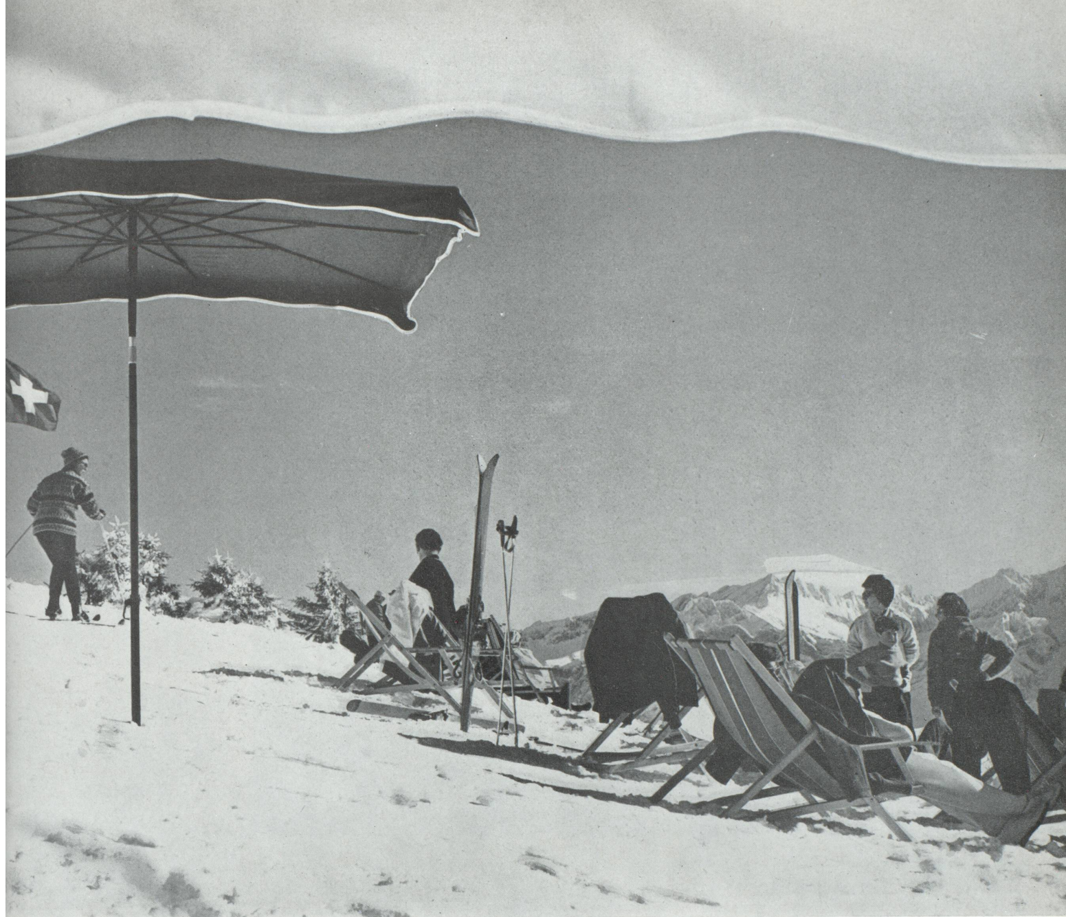
Au soleil de Villars-sur-Ollon.

« faire » — comme on dit — le plus de villes et de musées possible. Voyager, c'est contempler, assimiler, prendre contact avec des hommes différents; c'est aussi se laisser aller au simple plaisir de jouir des choses; c'est imaginer, c'est rêver, c'est être romantique à sa manière; c'est réapprendre à se promener, à consacrer à la flânerie le temps que les moyens modernes de transport permettent d'économiser. Cette révolution à la Rousseau des mœurs d'aujourd'hui suppose une conception touristique qui vise à offrir non pas des vacan-