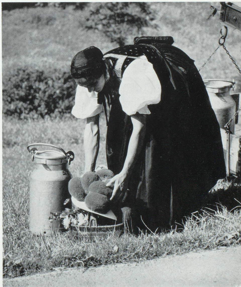
L'agriculture allemande est prise de peur devant le Marché Commun.

A l'appui de ces arguments on peut citer l'importante prise de position de l'Association des Chambres d'Indus-