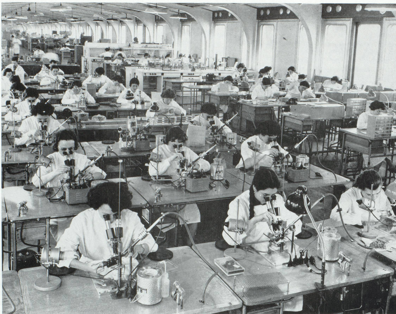
EXIGENCES DES TECHNIQUES. Dans cet atelier d'une usine française de matériels électroniques, les transistors en sont à un stade de micro-miniaturisation tel qu'ils doivent être montés sous microscope. L'évolution des techniques est, en ces domaines, si rapide qu'elle provoque le rapprochement des entreprises pour assumer les frais et mettre en commun les résultats des activités de recherche.

commune des fabrications ne va-t-elle pas réduire l'initiative et l'efficacité des directeurs locaux?