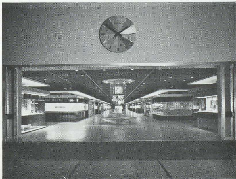
Entrée principale de la Foire de l'Horlogerie.

étonné aucune des personnes s'intéressant à l'activité économique suisse, tant les deux manifestations étaient différentes l'une de l'autre. L'Exposition de Lausanne, qui devait voir un grand nombre de visiteurs français franchir ses portes, s'attachait surtout à présenter les valeurs et les buts spirituels de la Suisse dans le cadre d'un beau livre d'images; alors qu'à Bâle, la Foire Suisse d'Échantillons poursuivait, comme d'ailleurs depuis près de 50 ans, son but éminemment commercial. Son leitmotiv est d'ailleurs, et restera inchangé : être le lieu de rencontre de l'offre et de la demande, un lieu où se concluent de bonnes et d'excellentes affaires en mettant en présence une fois par année producteurs et acheteurs. Grâce aux compagnies d'aviation AIR-INTER et SWISSAIR qui relient par la voie des airs la cité rhénane à la plupart des grandes villes françaises, vous pourrez vous rendre à la Foire de Bâle confortablement et dans un minimum de temps. De plus, d'excellentes liaisons ferroviaires existent aussi entre Bâle et la majorité des centres industriels et commerciaux par des trains rapides ou des routes directes.