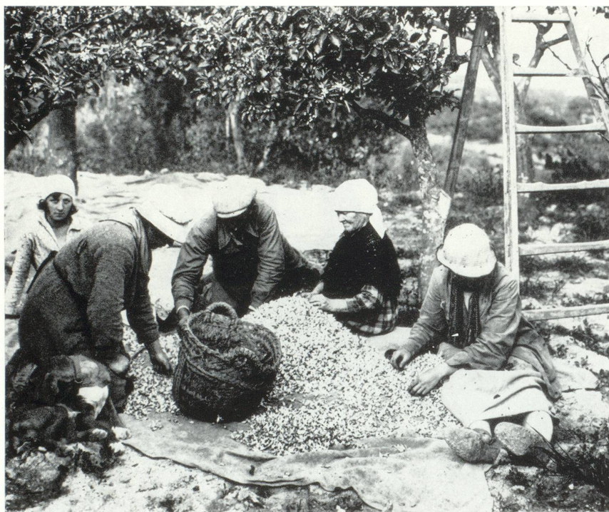
Épluchage des fleurs d'orangers à Vallauris (Alpes-Maritimes).

Essences naturelles, arômes synthétiques vont se soumettre aux multiples opérations; combinaisons boi-