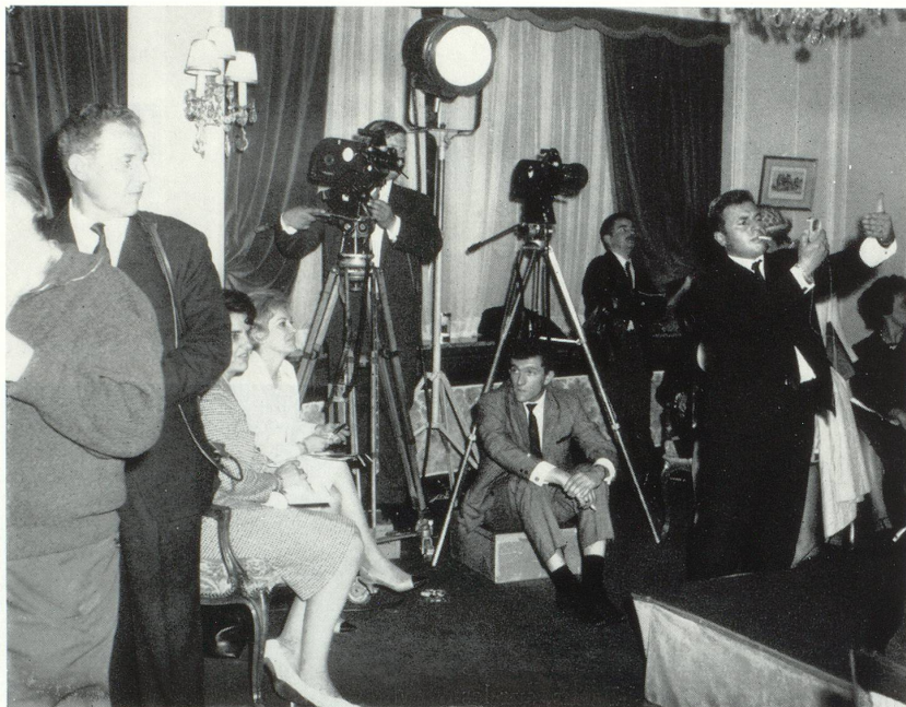
Photographes et opérateurs de la télévision et des actualités cinématographiques en pleine action.

Souhait certainement exaucé, car nos confrères et toutes les caméras sont braqués sur les étincelants messages genevois et romands.