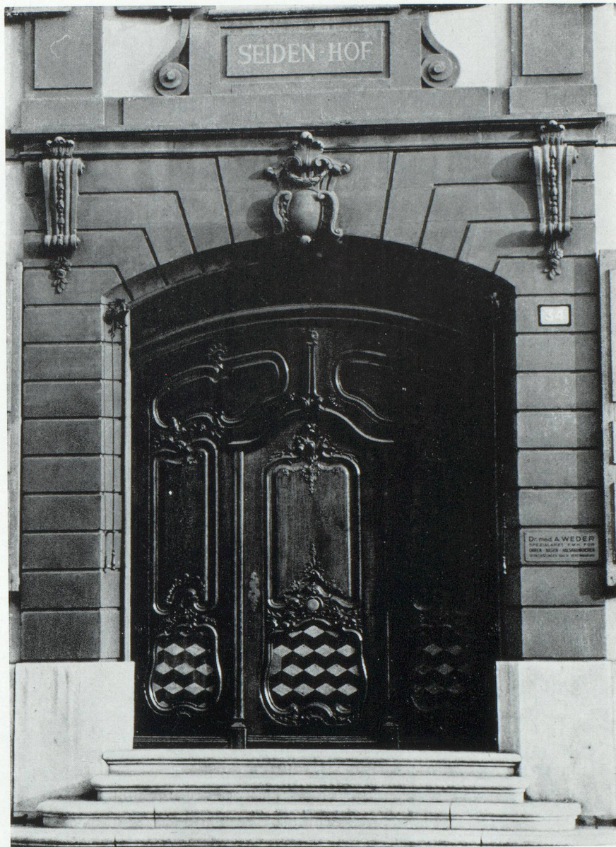
Portail d'une maison bourgeoise à Bâle.

Et les arts plastiques? Bâle a un cercle très actif de peintres et sculpteurs et sa population porte un grand intérêt à l'art moderne.