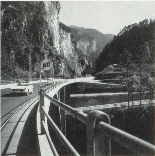
Route nationale de 3 e classe à Thuais (Grisons) sur la voie d'accès au tunnel San Bernardino (Coire-Bellinzone) qui sera ouvert au trafic en 1968.

territoire. C'est à ce stade qu'une commission consultative pour les routes nationales, où siègent des politiciens, des techniciens, des économistes et des représentants des usagers, soit une vingtaine de personnes, a été instituée par l'autorité fédérale responsable. Son premier objectif est de dresser un ordre d'urgence dans la réalisation du réseau envisagé. Cette tâche n'est pas aisée en raison des travaux déjà commencés et de promesses accordées. La détermination de diverses variantes, puis